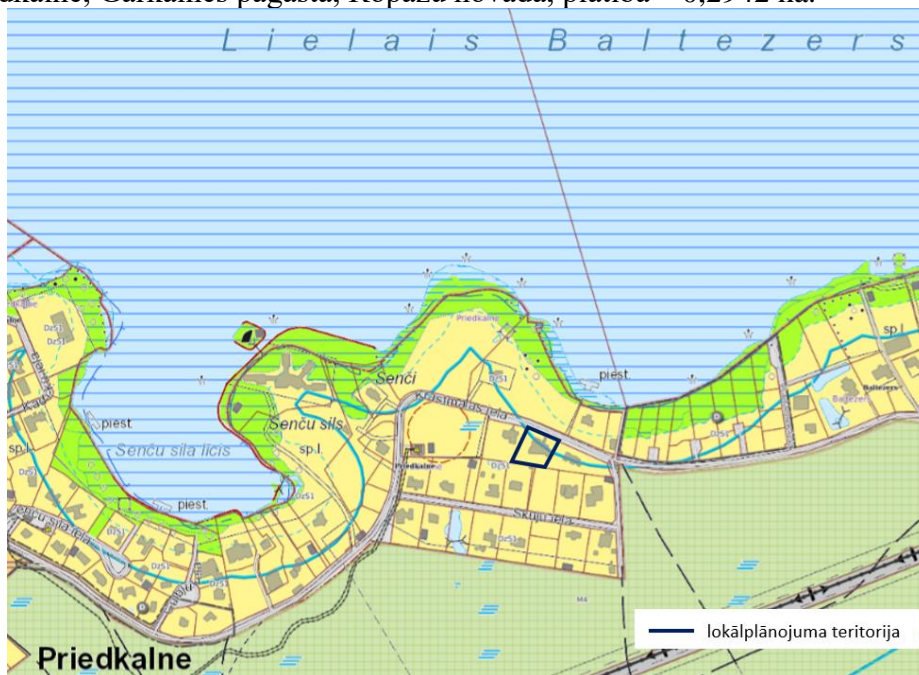
Fragments no teritorijas plānojuma funkcionālā zonējuma kartes

Nekustamā īpašuma ar kadastra numuru 8060 002 0209 sastāvā esoša zemes vienība Krastmalas iela 12 ar kadastra apzīmējumu 8060 002 0209, Priedkalnē, Garkalnes pagastā, Ropažu novadā, platība – 0,2942 ha.