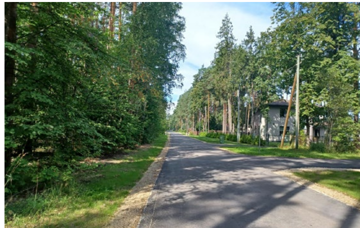
Priēžu iela, Garkalne

Būvdarbus veica SIA "MRG Būve", līguma summa 227 692,20 EUR bez PVN, būvuzraudzību nodrošināja SIA "Baltline