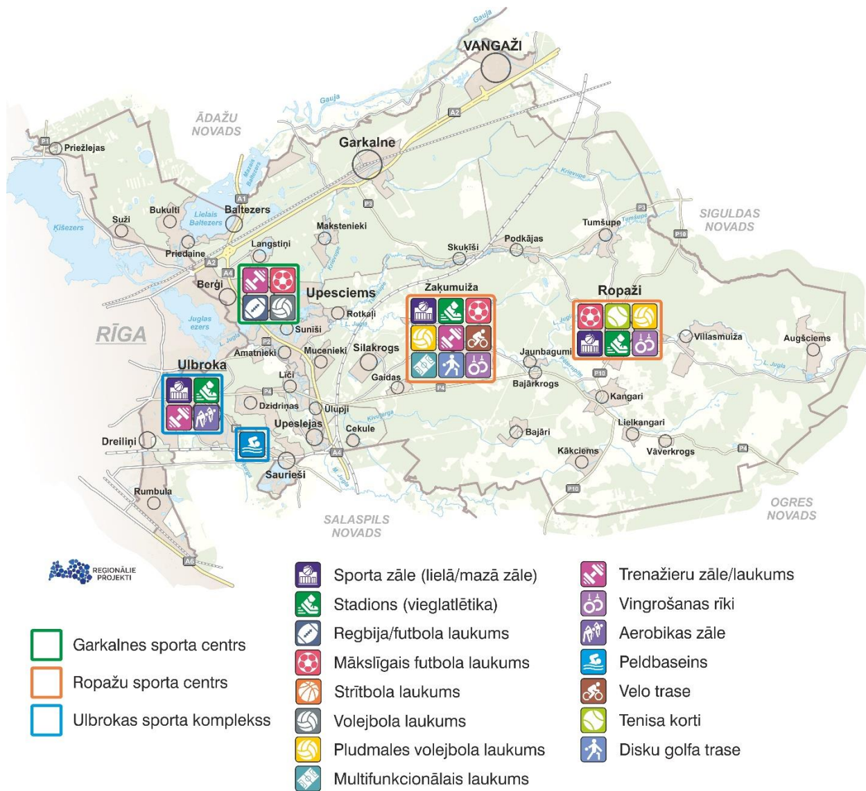
Attēls 3. Sporta iestāžu pārvaldībā esošā sporta infrastruktūra 42

Tikai Stopiņu baseins (tehnisku iemeslu dēļ) šobrīd nav izmantojams sporta aktivitātēm. Lielākoties objekti ir apmierinošā un labā stāvoklī.