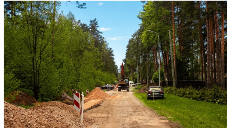
Priežu iela Garkalnē

13. maijā tika nodoti ekspluatācijā Ulbrokas Mūzikas un mākslas skolas ēkas fasādes atjaunošanas darbi. Projekta ietvaros veikta ēkas cokola siltināšana 40,18 m 2 , fasādes sienu siltināšana 606,50 m 2 , jumta siltināšana 208 m 2 , ieejas mezgla rekonstrukcija, nomainīti 40 logi un ārdurvis. Ārsienu siltinājums veikts no akmensvates fasādes plāksnēm un pilnas akmens masas fasādes plāksnēm sarkanā tonī ar teksturētu virsmu. Projekta rezultātā būtiski uzlabota ēkas energoefektivitāte, samazinājusies ēkas siltuma zudumi. Palielinājusies ēkas nesošo konstrukciju ilgmūžība un ēkas ekspluatācijas laiks. Rezultātā plānots sasniegt ietaupījumu 74 561,78 kWh/gadā, kā arī siltumnīcefekta (ogļskābe) gāzu samazinājumu 15,142 t CO 2 ekv. gadā. Būvniecības darbus veica SIA "LAGRON", kopējās būvniecības izmaksas 317 561,16 EUR bez PVN, būvuzraudzību veica SIA "Akorda", projekta autors un autoruzraugs SIA "Grand Eko". Projektu "Ulbrokas Mūzikas un mākslas skolas ēkas energoefektivitātes uz-