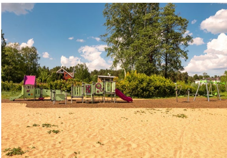
Rotaļlaukums Bukultos, Saulstaru ielā

labošana" (Nr. 4.2.2.0/21/A/068) atbalsta ERAF. Fonda finansējums ir 251 700,21 EUR, tajā skaitā būvniecības darbi, ko veic SIA "LAGRON".