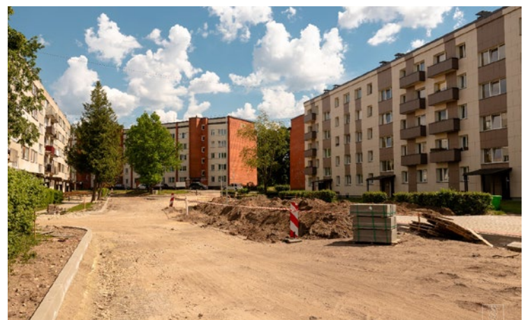
Siguldas iela Vangažos