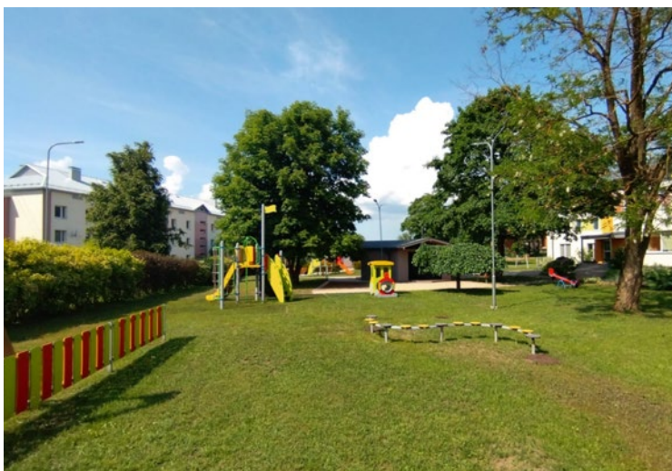
PII "Annele", Ropaži