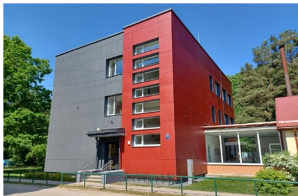
Institūta iela 1c, Ulbroka