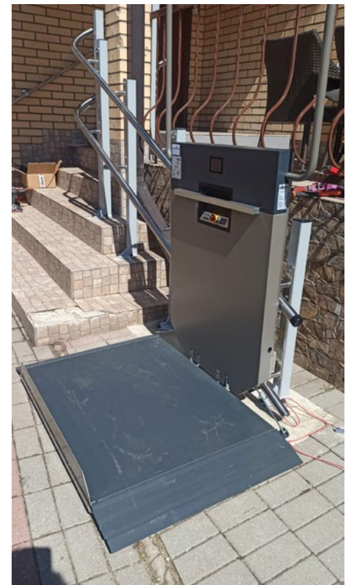
Pacelājs ar platformu