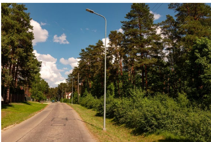
Ādažu iela Bukultos