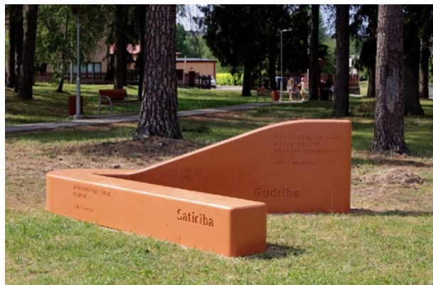
Strauta pļava, Vangazi