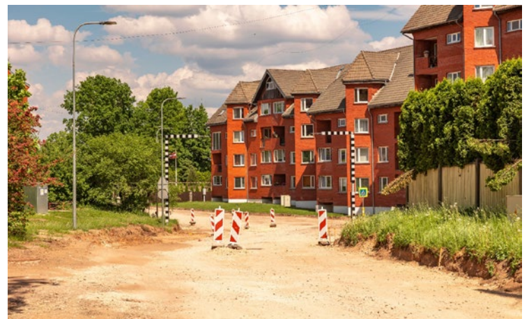
Ziedu iela Upesciemā