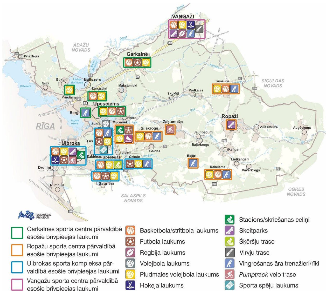
Attēls 4. Sporta iestāžu pārvaldībā esošie brīvpieejas laukumi

Sporta iestāžu pārvaldībā ir vairāk kā 20 laukumi dažādām sportiskām aktivitātēm un brīvā laika pavadīšanai, nodrošinot aktīvas atpūtas iespējas visa gada garumā – laukumi piemēroti strītbolam, basketbolam, futbolam, regbijam, volejbolam un pludmales volejbolam.