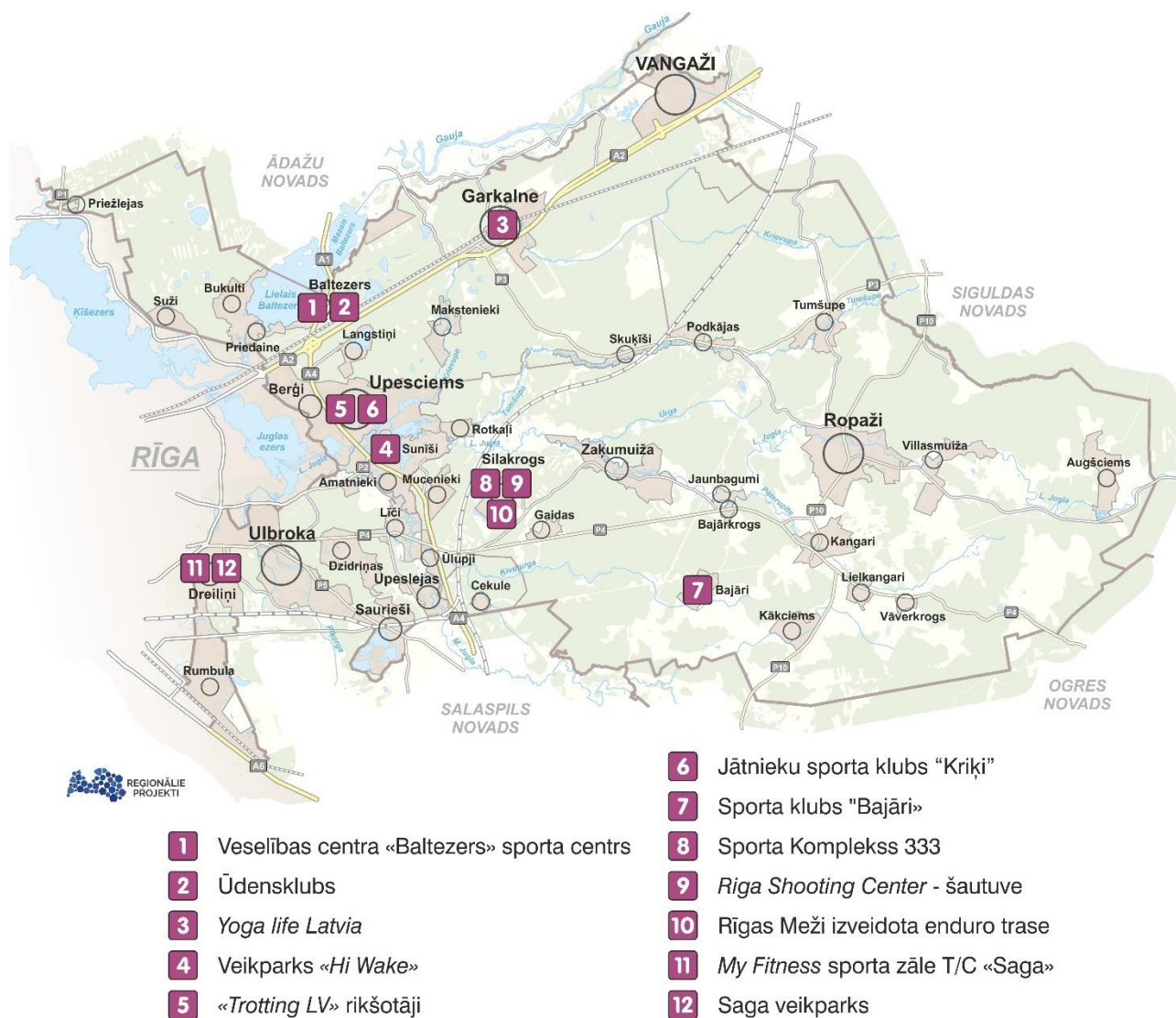
Attēls 6. Privātā sporta un aktīvās atpūtas infrastruktūra

Privātās atpūtas infrastruktūra piedāvājums papildina Pašvaldības veidoto infrastruktūru, tādējādi iedzīvotājiem ir iespējas nodarboties ar jāšanu, kalnu slēpošanu, auto – moto sportu, paintbolu, veikbordū u.tml.