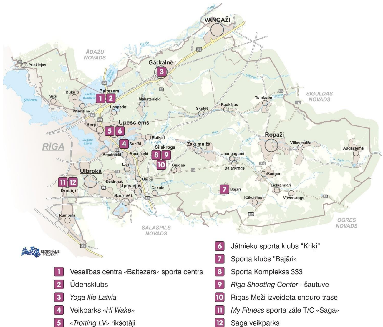
Attēls 6. Privātā sporta un aktīvās atpūtas infrastruktūra

Privātās atpūtas infrastruktūra piedāvājums papildina Pašvaldības veidoto infrastruktūru, tādējādi iedzīvotājiem ir iespējas nodarboties ar jāšanu, kalnu slēpošanu, auto – moto sportu, paintbolu, veikbordu u.tml.