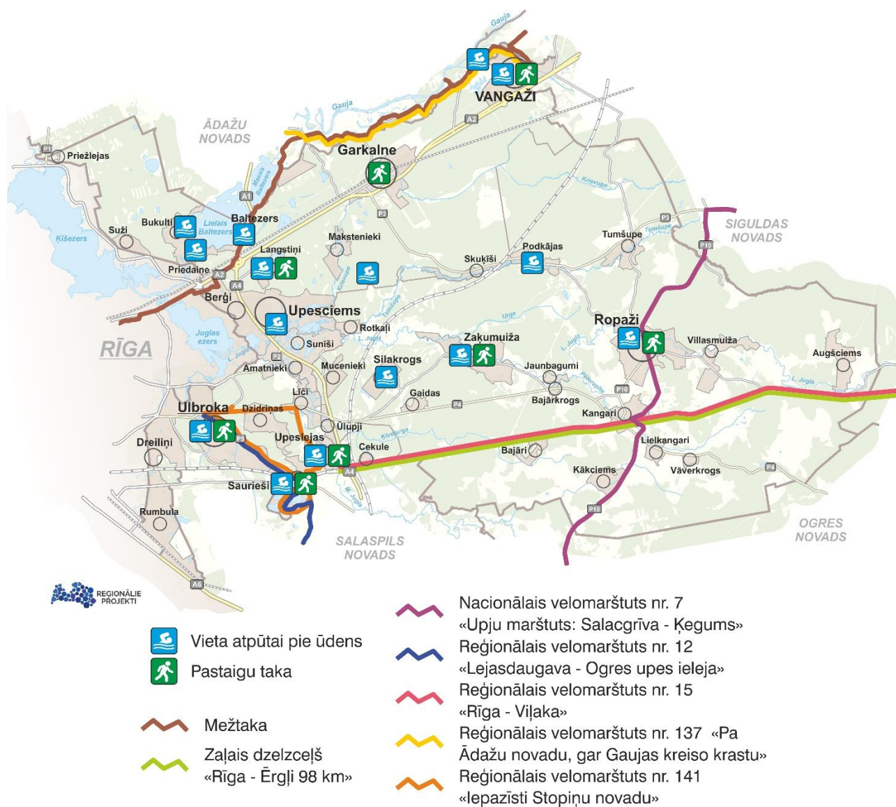
Attēls 5. Pārējā brīvpieejas infrastruktūra

Aktīvai atpūtai dabā pieejama Eiropas garās distances pārgājienu maršruta E11 daļa Baltijas valstīs – Mežtaka, četri reģionālie un viens nacionālais velomaršruts, arī maršruts “Zaļais dzelzceļš”. Pieejamas vairākas pastaigu takas (maršruti) – “Pastaiga Ropažos”, “Pastaiga Ulbrokā”, “Pastaiga Vangažos”, “Pastaiga Zaķumuižā”, “Pastaiga Langstiņos”, “Pastaiga Upeslejas – Saurieši”, “Pastaiga Garkalnē”. 40