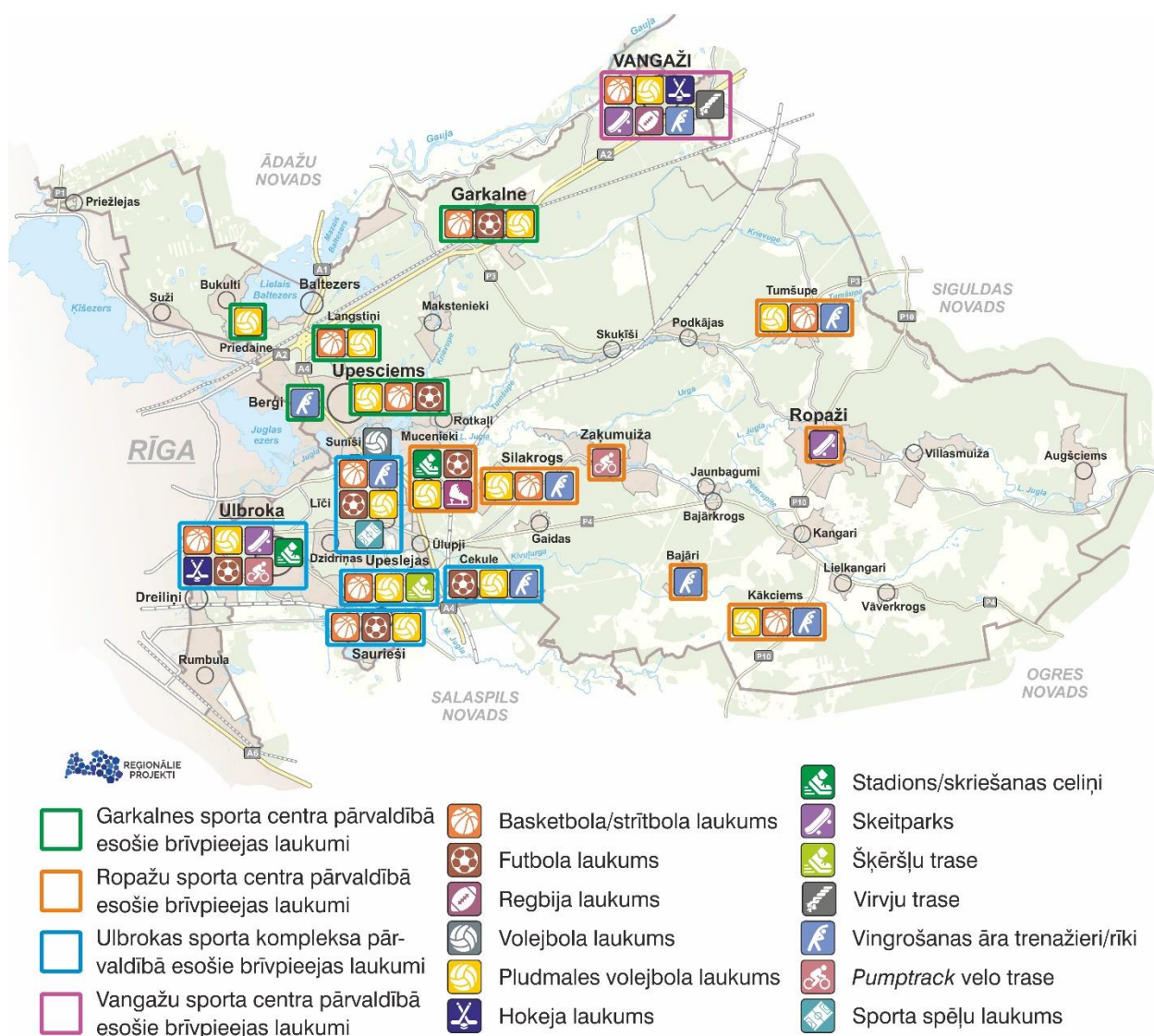
Attēls 4. Sporta iestāžu pārvaldībā esošie brīvpieejas laukumi

Sporta iestāžu pārvaldībā ir vairāk kā 20 laukumi dažādām sportiskām aktivitātēm un brīvā laika pavadīšanai, nodrošinot aktīvas atpūtas iespējas visa gada garumā – laukumi piemēroti strītbolam, basketbolam, futbolam, regbijam, volejbolam un pludmales volejbolam.