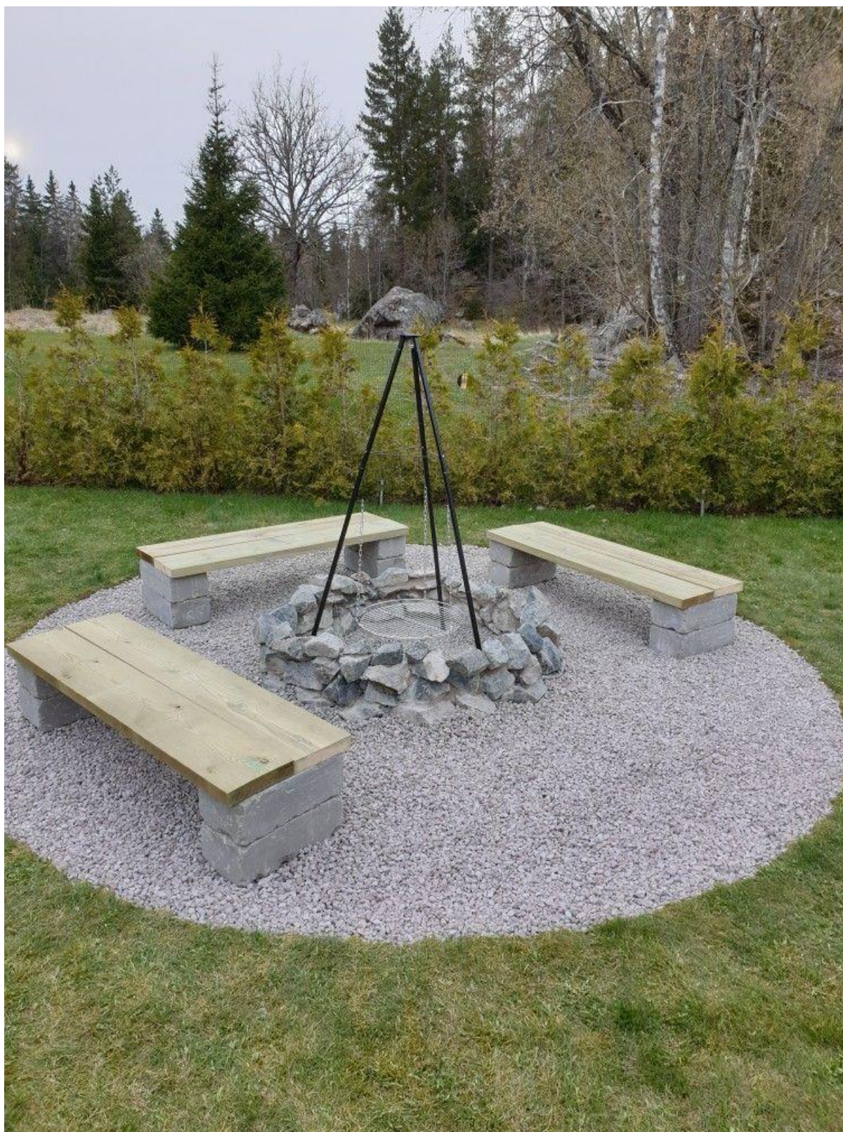
Grila vieta (iemūrējama)