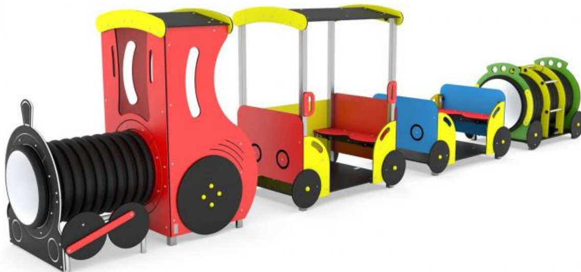
Bērnu vilcieniņš