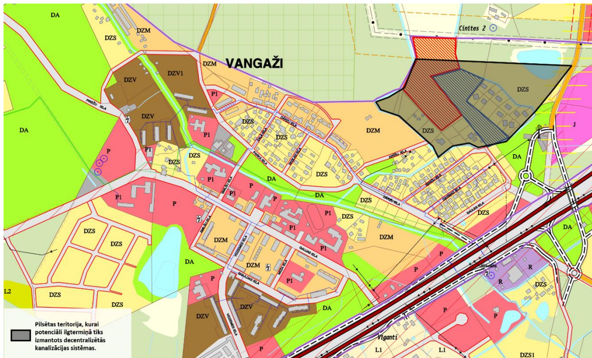
Pilsētas teritorija, kurai potenciāli ilgtermiņā tiks izmantotas decentralizētās kanalizācijas sistēmas (attēls 1)