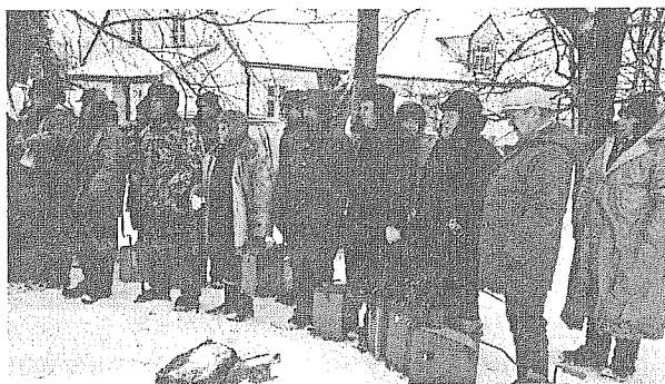
Pirms lielā loma...

2002. gada 23. februārī tika dots starts Stopiņu pagasta čempionātam zemledus makšķerēšanā.