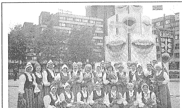
Klaipēdā, Atdzimšanas laukumā pie šī gada svētku simbola, kas attēlo, kā ar lūpām veido skaņu.

Kā jau šajos Ziemeļu un Baltijas valstu dziesmu