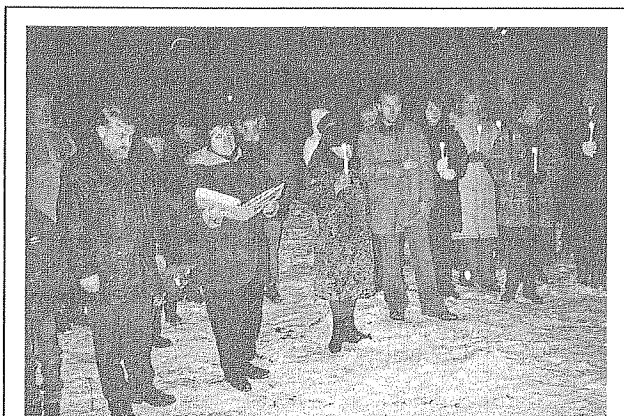
Atceres mirklis pie Lāčplēša ordeņa kavalieru piemiņas akmens

11. novembrī daudzviet Latvijā godā tika celti un pieminēti Lāčplēša ordeņa kavalieri. Arī mūsu pagastā 11. novembra vakarā pulcējāmies pie Lāčplēša ordeņa kavalieru piemiņas akmens, lai ar mums visiem mīļām dziesmām sveču gaišajās liesmiņām degot pieminētu savas tautas vēsturi.