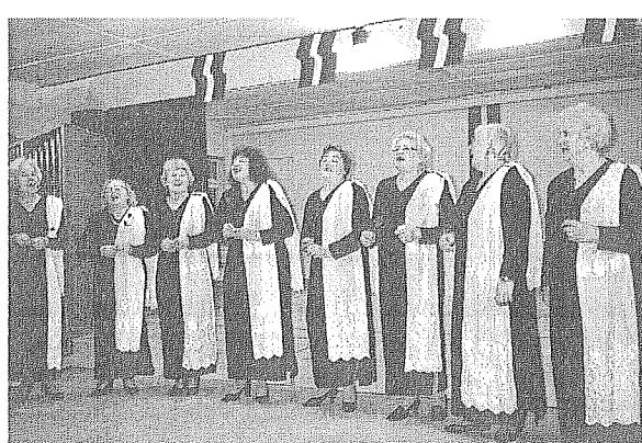
„Ievziedu” atraktīvais priekšnesums neatstāja vienaldzīgu nevienu no zālē sēdošajiem

visiem tik nozīmīgus vārdus. Koncertu vadīja un klausītājus ar savu neizsīkstošo dzīvesprieku un mirdzošo acu skatienu valdzināja mūsu tautā tik iemīļotā aktrise