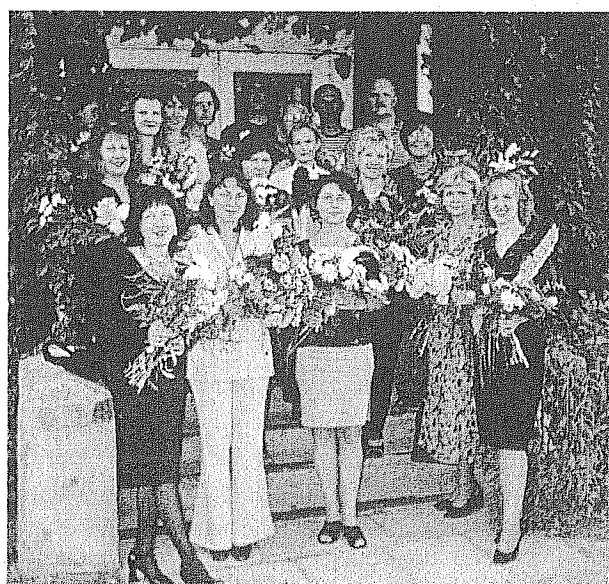
Pedagogu kolektīvs 2002. gada 1. septembrī

Šī mācību gada sākumā tika veikta izglītības iestādes akreditācija (termiņš 2007. gada 31. jūlijs), skolai ir izsniegta Izglītības un zinātnes ministrijas licence par izglītības programmu veikšanu (termiņš 2007. gada 31. jūlijs). Licencētas izglītības programmas ir – instrumentālā mūzika (apakšprogrammas klavierspēle, vijolspēle, akordeona spēle, kokles spēle, flautas spēle,