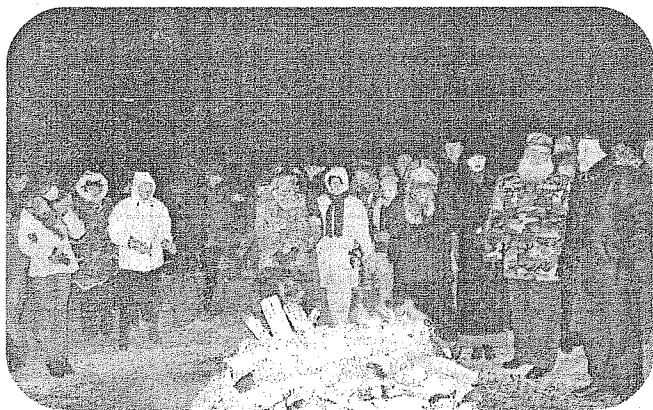
Pie ugunsкура pulcējušies novada iedzīvotāji