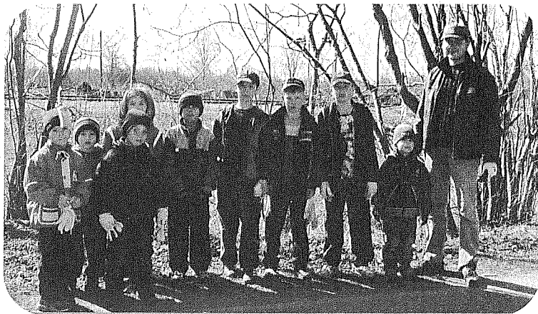
Sauriešos vienīgais tētis, kas šajā sestdienas rītā bija gatavs iziet laukā, lai sakoptu ciemata apkārtni, uzņemdamies atbildību arī pār prāvu pulciņu mazo talcinieku!