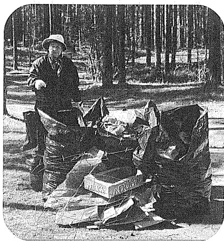
Pēc padarītā darba visur bija redzami atkritumu maisu kalni