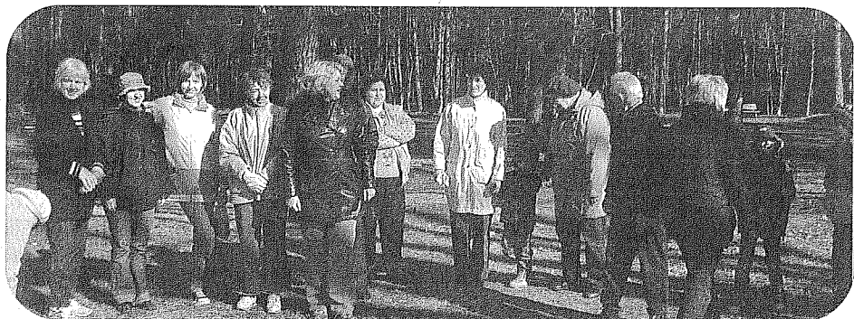
Ulbrokas ciemata talcinieki gatavojas lielajam darbam!

Vai mūsu mājas ir vieta, kur ēdam vai gulam? Dzīvoklis vai māja? Nē, uz šiem jautājumiem man atbild talcinieki, kas katru pavasari atbalsta novada rīkoto talku. "Mūsu mājas ir mūsu ciemats un mūsu novads!"