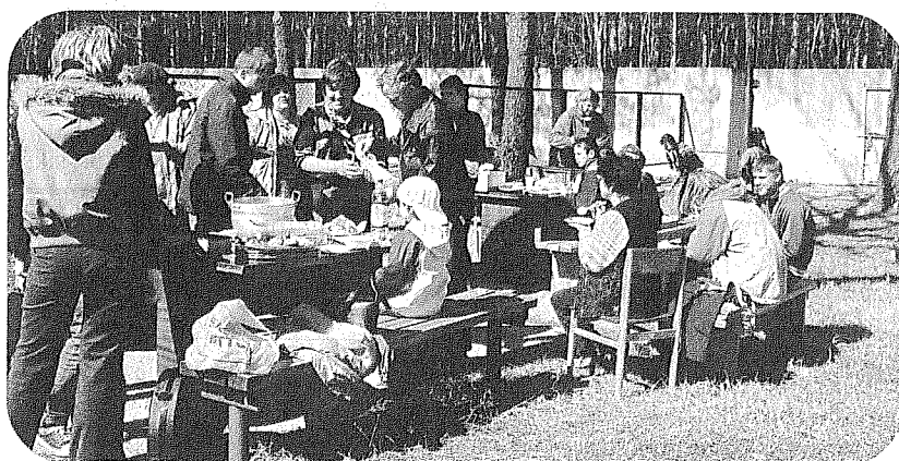
Tiem, kas labi strādā ir arī labi jāēd. Tāpēc novads sagādāja visiem darbīgajiem laudim kārtīgas pusdienas.

Pēc visa redzētā gribētos tikai piebilst, ka nākamgad uz talku tiek aicināti arī visu pašvaldības iestāžu, aģentūru un organizāciju darbinieki, kā arī pieaugušie Sauriešu ciematā, jo mēs – pieaugušie, bieži vainojam bērnus, ka viņi nemāk uzvesties un piegružo apkārtējo vidi, bet šajā talkā viņi – bērni un jaunieši bija aktīvākie talcinieki un lielākais vairums mūs – pieaugušo, tikai noskatījās!