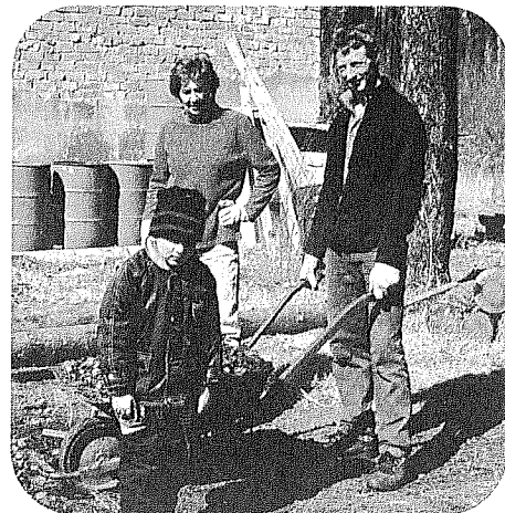
Cekules ciemata talcinieki izrādījās visāšākie un kad citos ciematos darbs vēl nebija i pusē, viņi visu jau bija padarījuši.