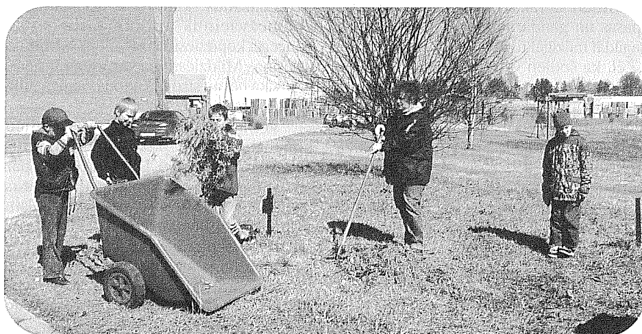
Iebraucot Līču ciematā nezinātājs apmulstu no notiekošā... Visos pagalmos, katrā krūmiņā rosījās cilvēki. Tie bija līču talcinieki, kas ne tikai savāca gružus, bet arī visas vecā gada lapas un zāli, kas stingrā uzmanībā tika sadedzinātas daudzās ugunskuros, laižot debesīs dūmu mākoņus.