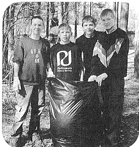
Upeslejas pārspēja visu novada ciematus talcinieku skaita ziņā. Vairāk nekā 80 cilvēki bija devušies pavasara talkā. Ģimenes pat trijās paaudzēs rosījās tīrot māju apkārtni un tuvējos mežiņus.