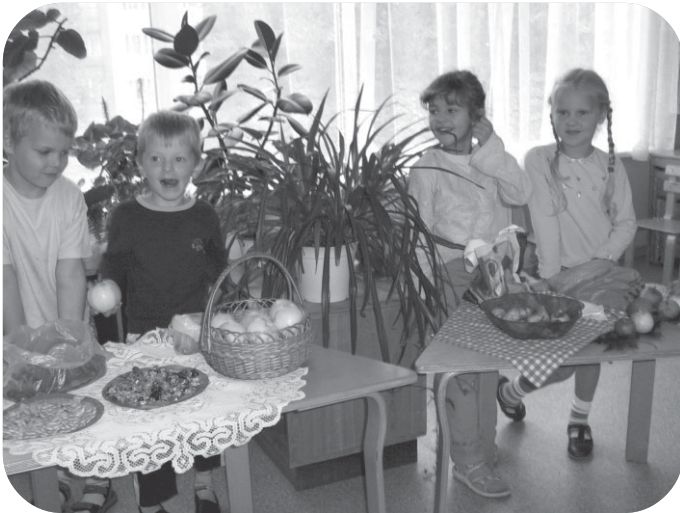
Miķeļu tirgū katrs tirgotājs reklamē savu preci.