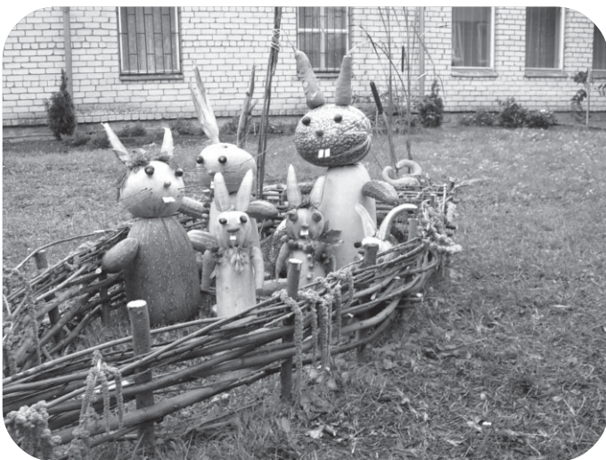
“Zaķēnu” grupas kuģotāji savā kuģī sēdina tikai ķirbju zaķus.