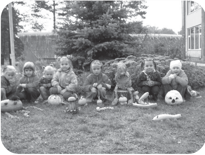
“Knīpas un Knauķu” grupas metenes labprāt fotogrāfējas kopā ar savas grupas veidoto kartupeļu astonkāji.