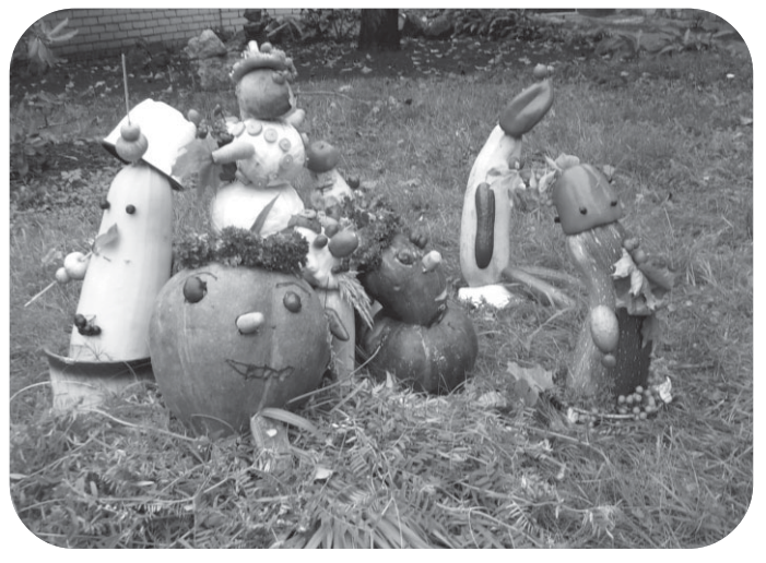
Ķirbju un kabaču vīriņi pavērsuši skatienus uz ēkas pusi gaida savus lielos un mazos skatītājus.