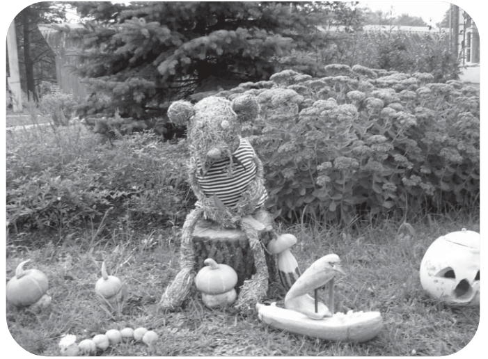
Liels salmu peluks iejuties dārza uzrauga lomā.