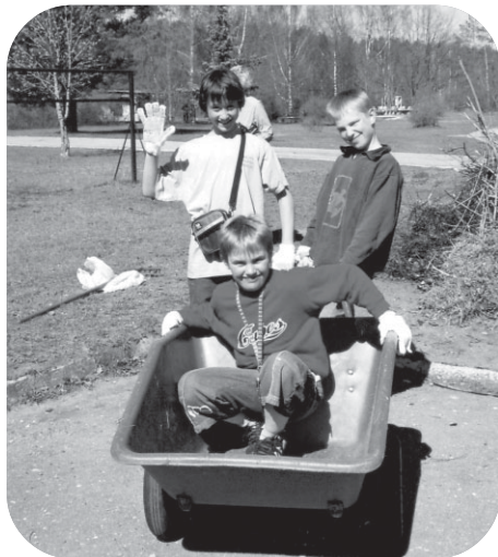
Čaklie Līču ciemata jaunieši atrada mirkli foto uzņemšanai "Tēvzemītes" objektīvam