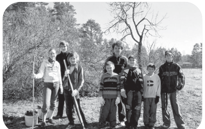
Cekules jaunatklātā dienas centra jaunieši ar PA "Saimnieks" pārstāvjiem sakopj ciemata apkārtni. Šogad Cekulē pulcējās kups skaits talcinieku