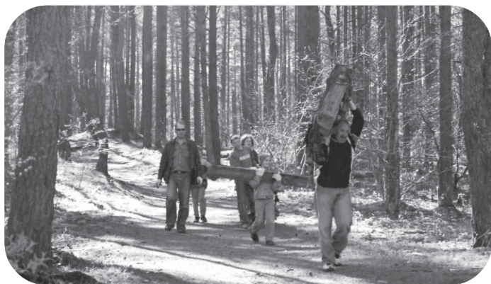
Šogad, pateicoties PA "Saimnieks" aktīvai dalībai pavasara talkā, tika iztīrīts arī mežiņš pie Upesleju ciemata