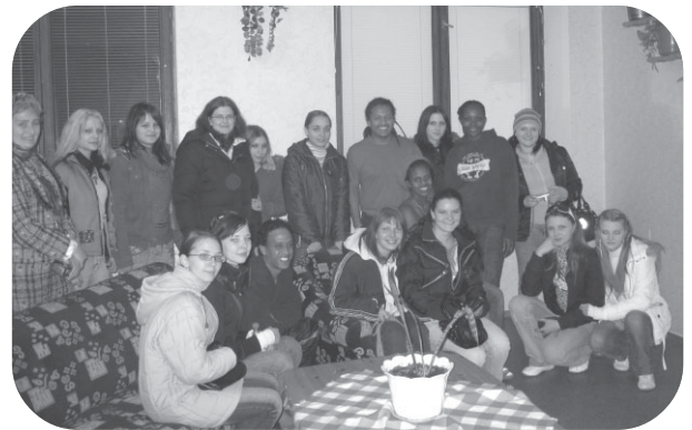
Lietuvas bēgļu centrs "Rukla". foto kopā ar patvēruma meklētājiem no dažādām valstīm

devāmies ceļā uz Viļņu, lai apskatītu Eiropas parku – vienu no iespaidīgākajiem mūsdienīgās mākslas muzejiem zem atklātām debesīm. Eiropas parku dibināja 1991. gadā Lietuvas tēlnieks Gintars Kross, atklāja 1993. gadā. Muzeja mērķis - ar mākslas valodu piešķirt jēgu Eiropas kontinenta centram. Parkā tiek eksponētas vairāk kā 100 skulptūras, parka teritorija ir 55 hektāri. Muzeja kolekcijā ir arī tādu slavenu autoru darbi, kā Abakanowicz, Oppeuheim, Le Witt u.c. Eiropas parkā kādreiz bija iespēja