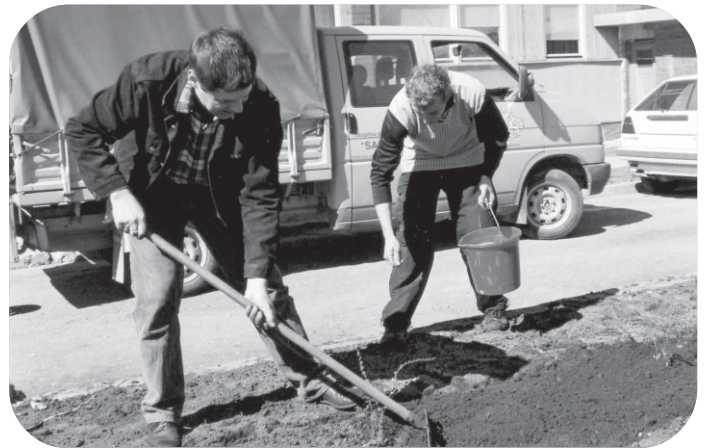
Un šogad atkal Līčos ziedēs skaistās Spirejas