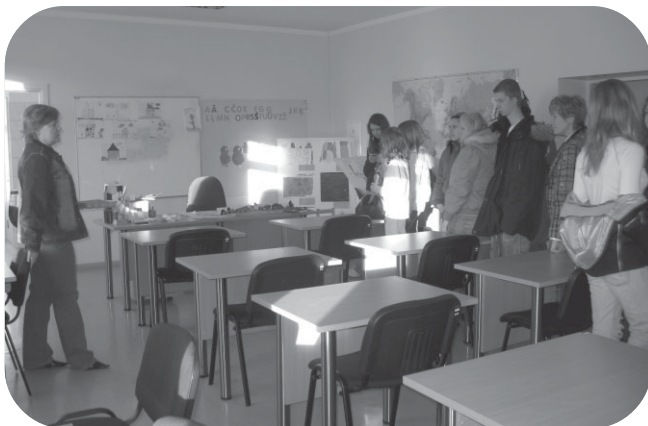
PMIC "Mucenieki" mācību un datorklase

Saulains laiks mūs pavadīja visā ceļa garumā. Ierodoties Bēgļu centrā Rukla mūsu grupu sagaidīja centra vadītājs