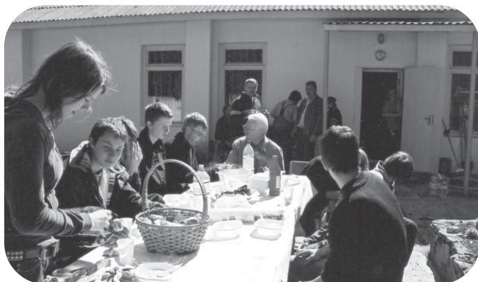
Pēc labi padarīta darba talcīnieki mīlojās ar ceptām desiņām un pīrādžiņiem