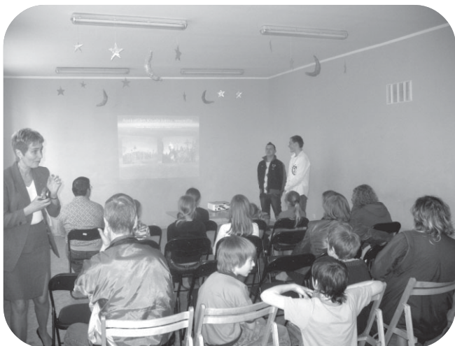
Projekta prezentācija Upeslejās