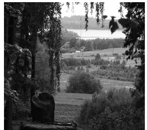
VIDZEMES SKAISTIE SKATI