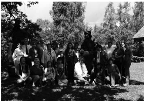
STOPIŅU NOVADA LĪGOTĀJI «KALNA KAIBĒNOS»

Jāņu nakts tuvošanās un dabas ziedošā, spēcinošā burvība Stopiņu novada bibliotēkas ļaudis mudina doties Vidzemes Centrālās augstienes virzienā. Ceļš, kas, mūs pavada, paver nebijušus skatus, kur daba kā bez prāta un sirds kā ziedu pļava, plūcot jāņuzāles un pinot vainagus, ļauj skatīt ko ļoti sirsnīgu un nozīmīgu literāri kultūrvēsturisko vērtību un latvisko tradīciju ziņā.