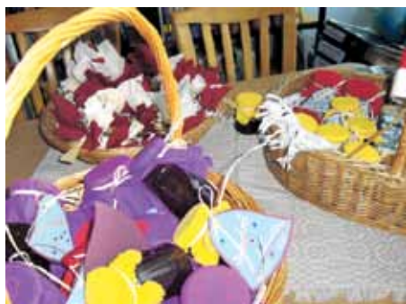
Kopējā darba rezultāts, Ulbrokas bibliotēka 2010. gada 9., 16. decembris