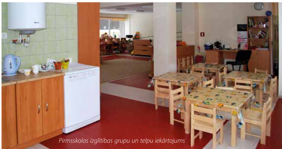
Pirmsskolas izglītības grupu un telpu iekārtojums