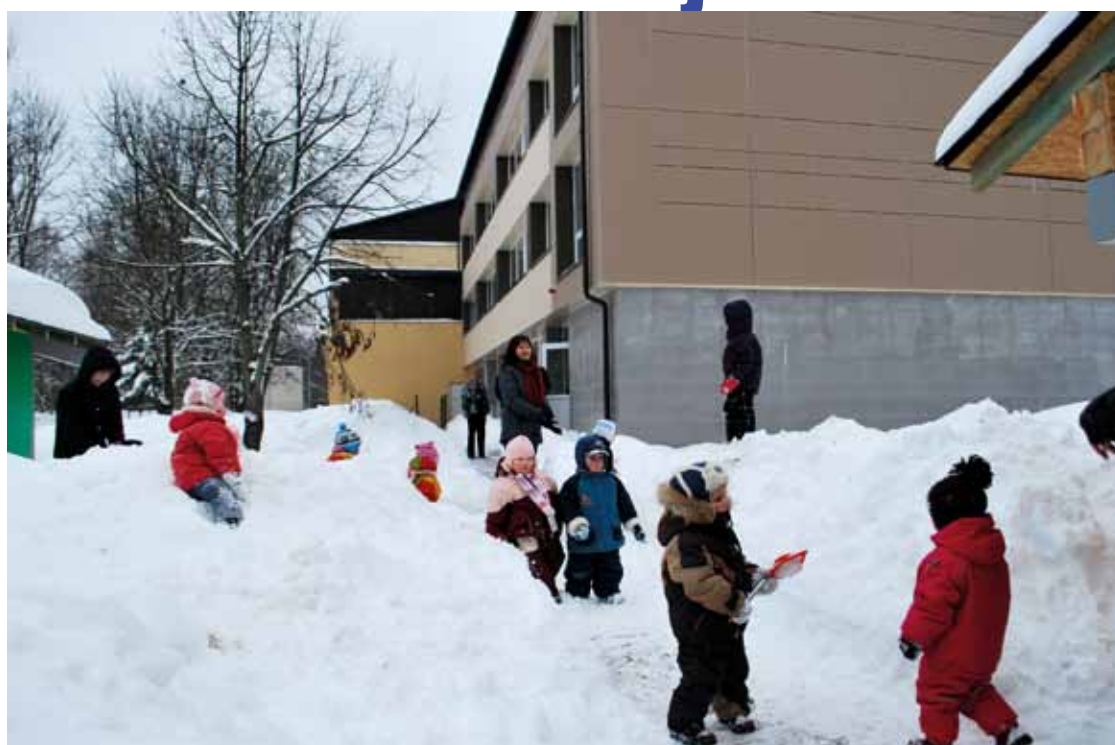
Upesleju internātpamatskolas - rehabilitācijas centra pirmsskolas izglītības grupu renovētais korpus