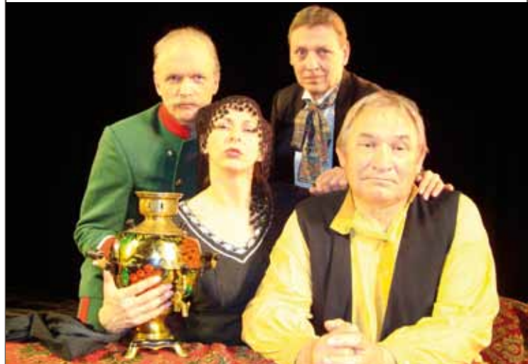
Ieeja: Ls 2; pensionāriem un represētājiem: Ls 1 Pēc izrādes – pavasarīgu noskaņu caurvīta "Marta balle" kopā ar grupu "Baltā māja".

Iestudējumu veidojis izrādes "Pērku Jūsu vīru" režisors Indulis Smiltēns.