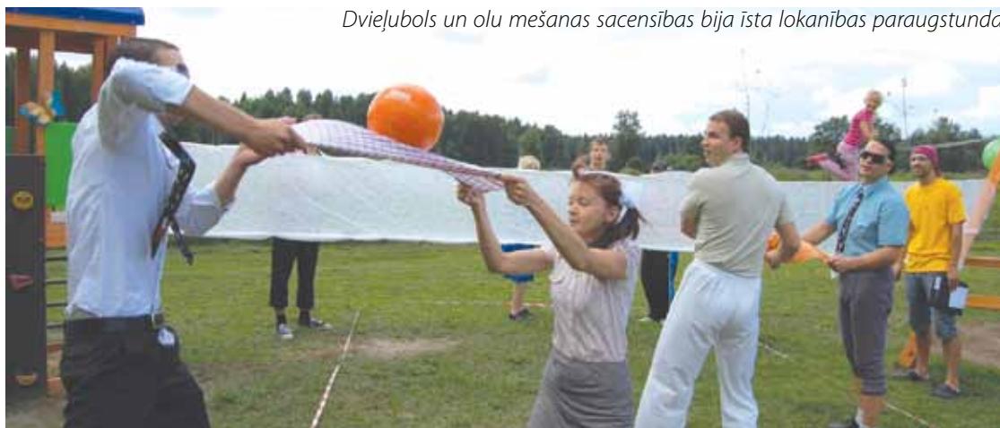
Dvieļubols un olu mešanas sacensības bija īsta lokanības paraugstunda.

Neraugoties uz meteorologu drūmajām prognozēm, saules un negaisa dievi pasākuma dalībniekiem bija īpaši vēligi – pirmās lietus lāses pār Jaunsišu ciemata pļavu nolija burtiski pāris minūtes pēc tam, kad pēdējā uzdevumā – orientēšanās sacensībās "Tauriņš dodas pasaulē" – finišēja pēdējā komanda. Tiesa, tas pasākuma dalībniekiem netraucēja baudīt vakaru. Pārdesmit minūtes lietus dušas, balvas veiksmīgākajiem, atraktīvākajiem un visādi citādi pamanāmākajiem, un Jaunsišu ciemata festivāla "Tauriņu vasara