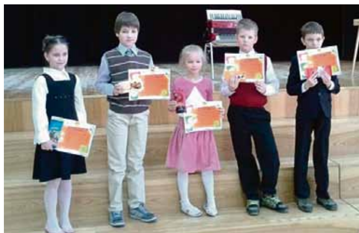
2. vietas ieguvēji