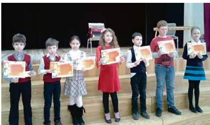
3. vietas ieguvēji