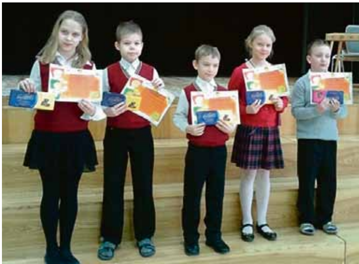
1. vietas ieguvēji