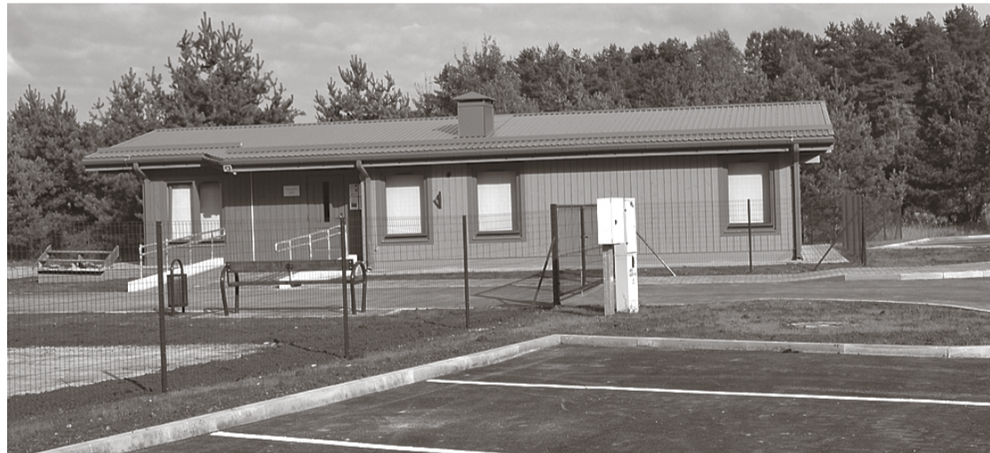
Augustā tika veikta Liču dienas centra apkārtnes labiekārtošana un piebraucamā ceļa sakārtošana.