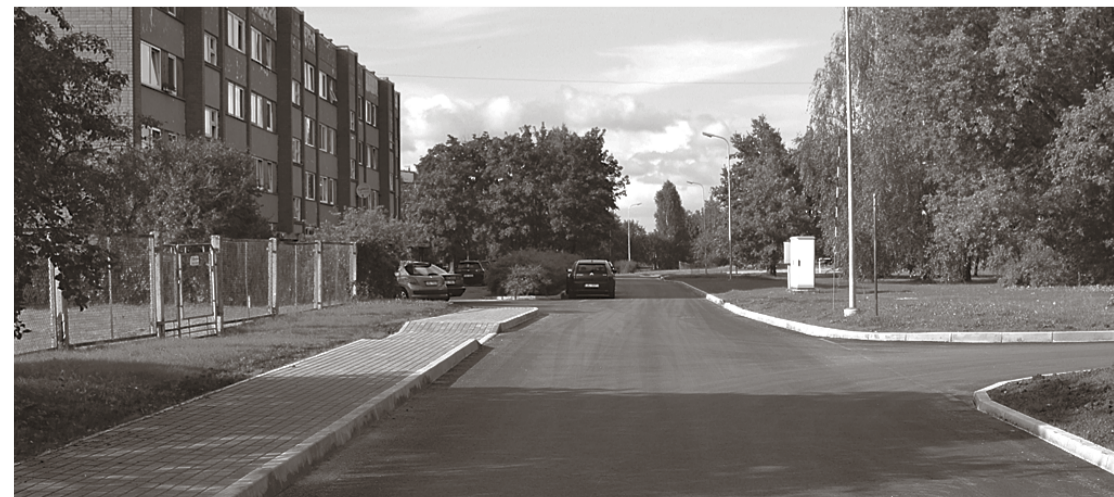
Noasfaltēta iela no Lubānas šosejas līdz mājai „Bebri” Ličos.