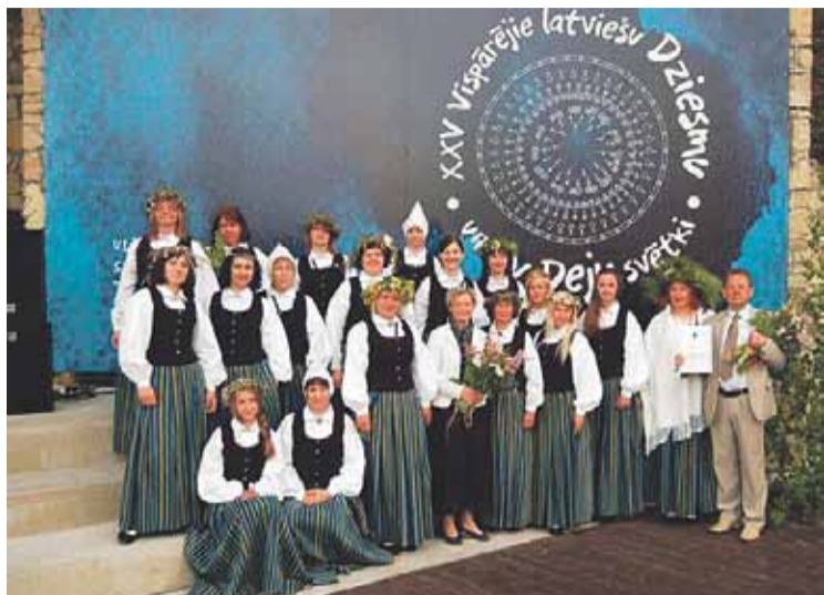
Koris „Madara”, projekts „Tautas tērpu iegāde sabiedrisko aktivitāšu dažādošanai Stopiņu un Salaspils novadu lauku iedzīvotājiem” 8190,69 EUR