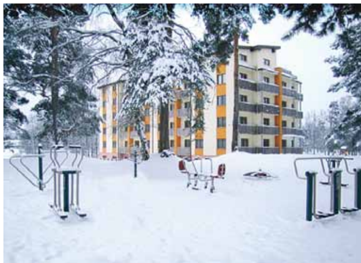
Biedrība „Socintegra”, projekts „Svaiga gaisa fitness”, 21 444,5 EUR