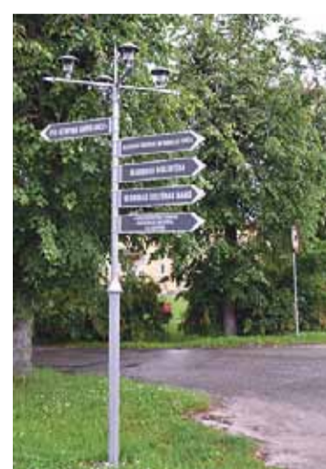
Stopiņu novada dome, projekts „Teritorijas norāžu un informatīvo stendu uzstādīšana Stopiņu novadā”, 5291,68 EUR

LEADER vietējā rīcības grupa – biedrība „Stopiņu Salaspils Partnerība” – dibināta 2009. gada 17. septembrī. „Partnerība” darbojas Stopiņu novada un Salaspils novada pašvaldības lauku teritorijā. Biedrībā pašlaik darbojas 23 biedri – gan Stopiņu un Salaspils pašvaldību pārstāvji, gan uzņēmēji un nevalstisko organizāciju pārstāvji, gan individuālie biedri.