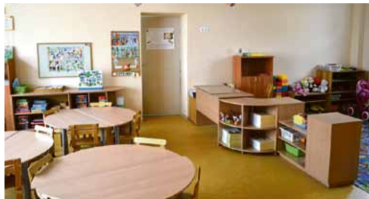
Izremontētā „Gliemezišu” grupas telpa PII „Pienenīte”.