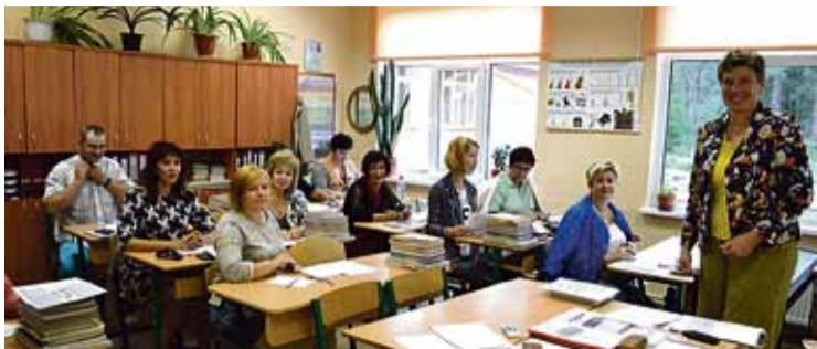
Stopiņu pamatskolas pedagogi apspriežas pirms jaunā mācību gada uzsākšanas.

Pirmsskolas izglītības iestādes audzēkņiem iegādāts rotaļu komplekts „Vilciens” par 3182,30 EUR. Skolai iegādāti divi datori kopsummā par 1863,73 EUR. Vienai pirmsskolas izglītības grupai iegādātas jaunas gultas par 2119,12 EUR. Iegādāti soli, krēsli, skapji 1100 EUR vērtībā. Ugunsdrošības jomā (metāla durvju ielikšana u.c.), ieguldīti 2060 EUR. Pašu spēkiem veikti krāsošanas darbi, krāsu izmaksas – 680 EUR.