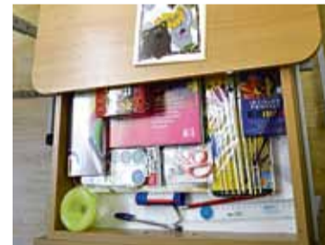
Mazos pirmklasniekus jau gaida pašvaldības sarūpētie mācību piederumi.