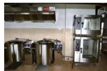
Jaunā tehnika Ulbrokas vidusskolas virtuvē gatava darbam.