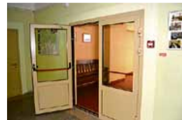
Skolas gaitenā ielikta ugunsdrošas durvis.