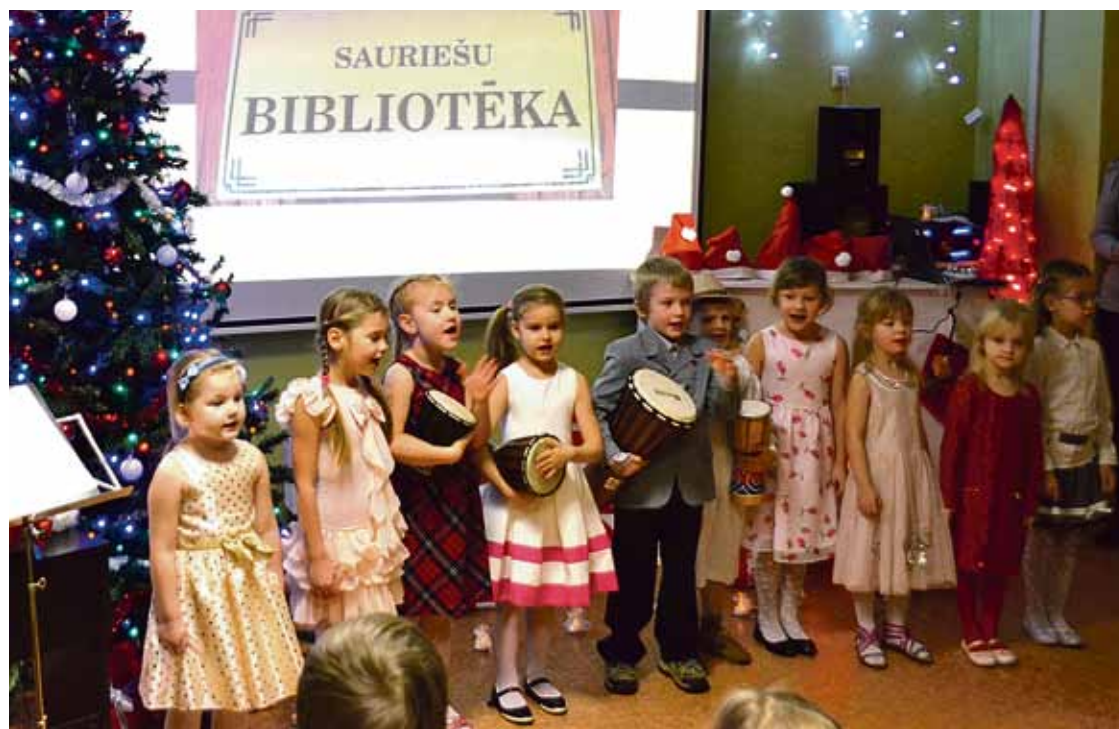
Muzikālu sveicienu bija sarūpējuši grupas „Zīļuki” bērni.

Dokuments atrodams, ka Stopiņu ciema bibliotēka dibināta 1946. gadā, laika gaitā tā pārtapa par Stopiņu novada Sauriešu bibliotēku. Bibliotēkas pasē mi-