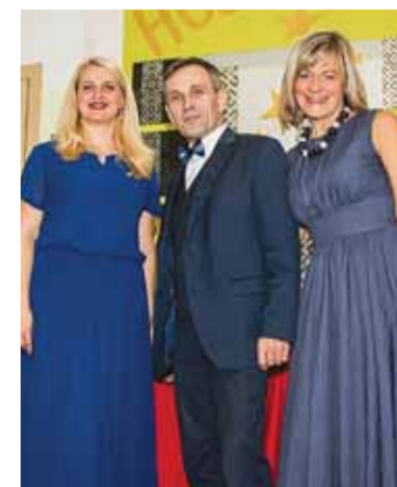
Reportāžas foto: no „Tēvzemītes” arhīva