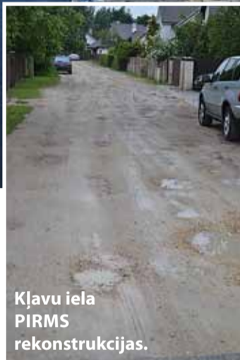
Kļavu iela PIRMS rekonstrukcijas.

Stopiņu novada domes sabiedrisko attiecību speciāliste