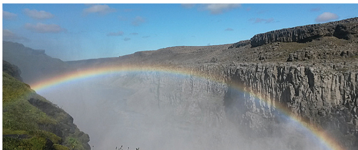
Islandes ainava.

14. februārī Ulbrokas bibliotēkā pulcējās gan vecāki, gan jaunāki