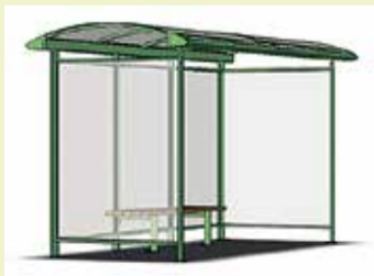
1. variants – 56

Balsojuma rezultāti, apkopojot elektroniski un rakstiski iesniegtās atbildes: