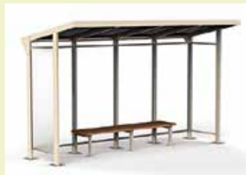
2. variants – 47