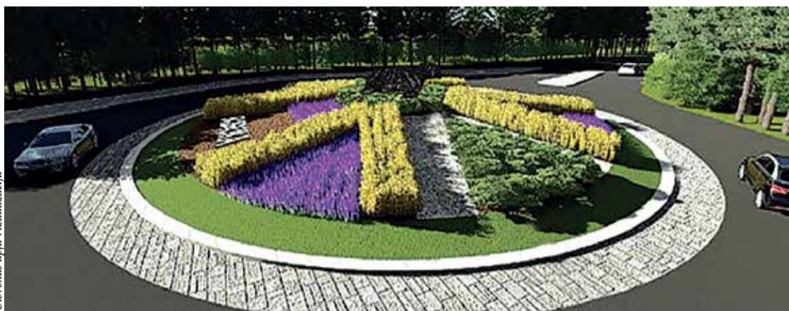
Ulbrokas apļa vizualizācija

Aptaujas laikā balsojumi saņemti tikai elektroniski, kopā aptaujā piedalījušies 762 respon-