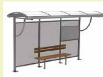
3. variants – 4

Par trim piedāvātajiem variantiem elektroniski nobalsojuši 57 respondenti, rakstiski – 52, kopā – 109.