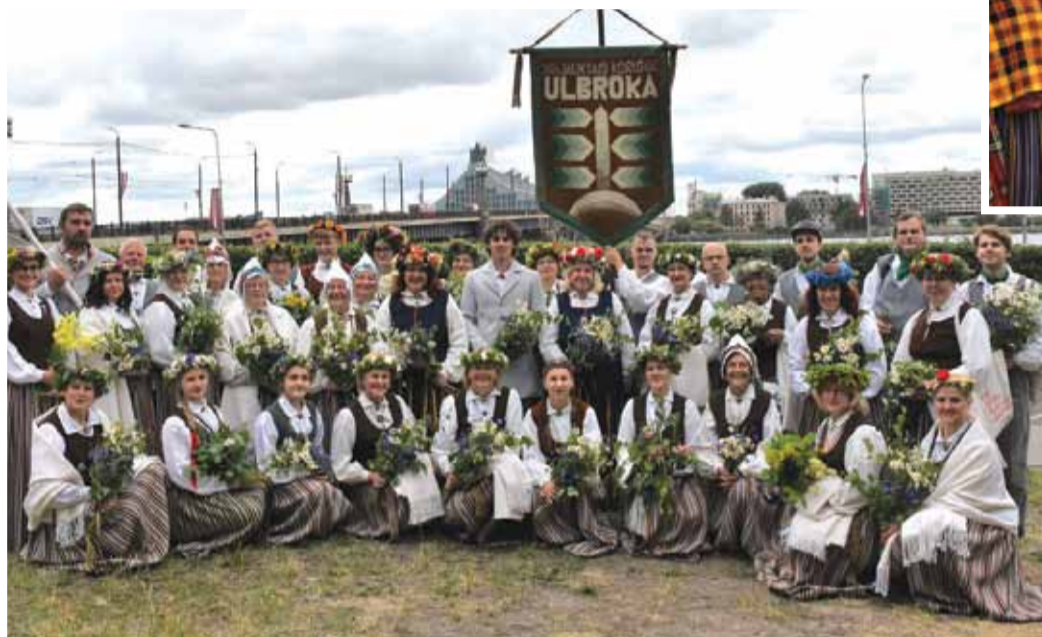
Jauktais koris „Ulbroka”.