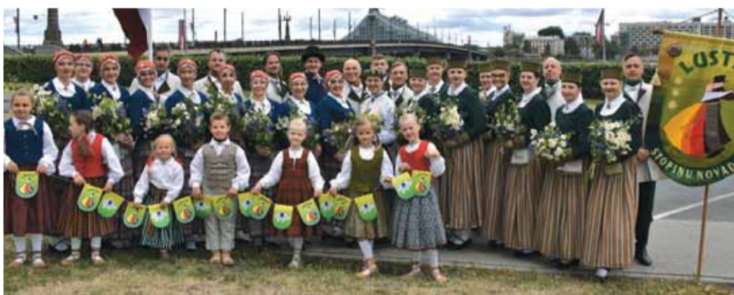
Vidējās paaudzes deju kolektīvs „Luste”.