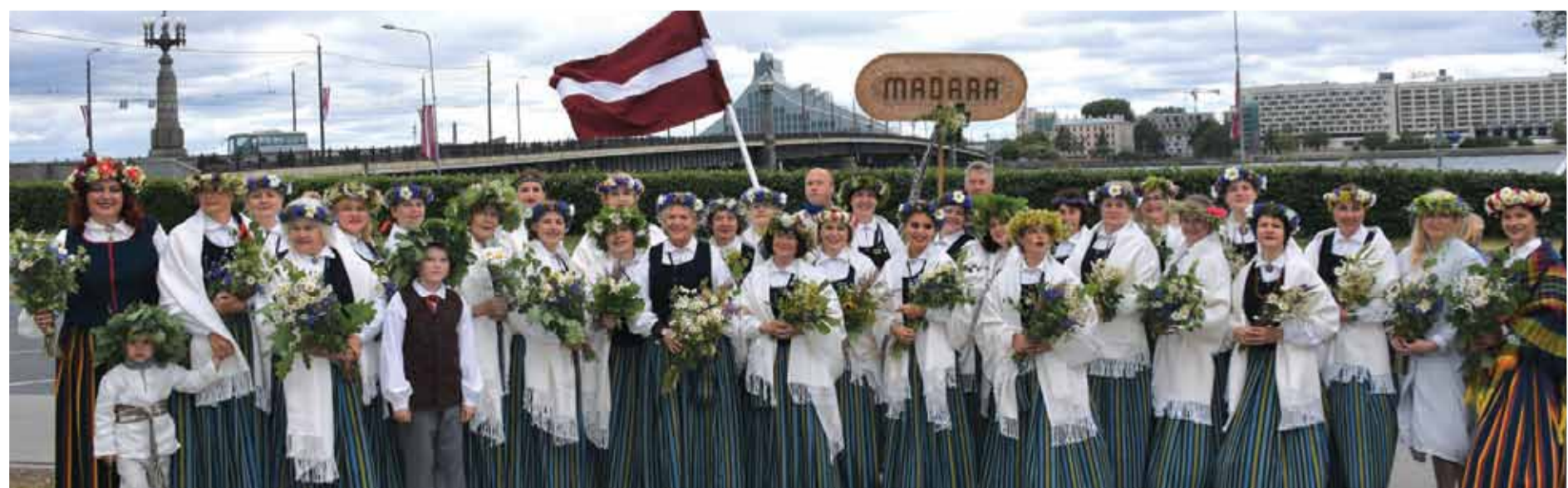
Sieviešu koris „Madara”.