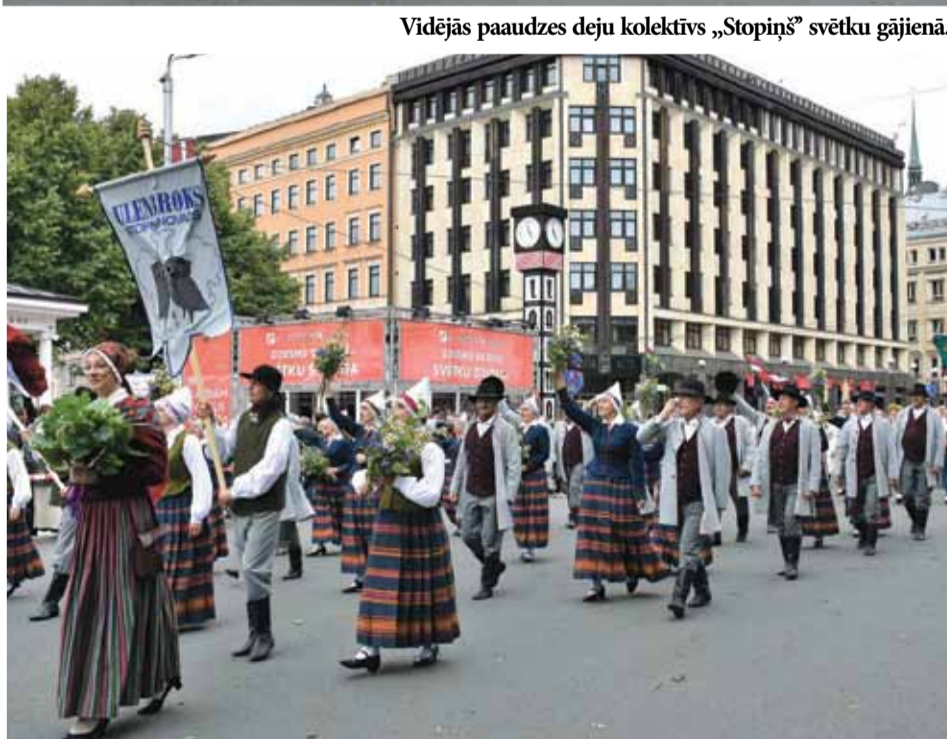
Senioru deju kolektīvs „Ulenbroks” svētku gājienā.