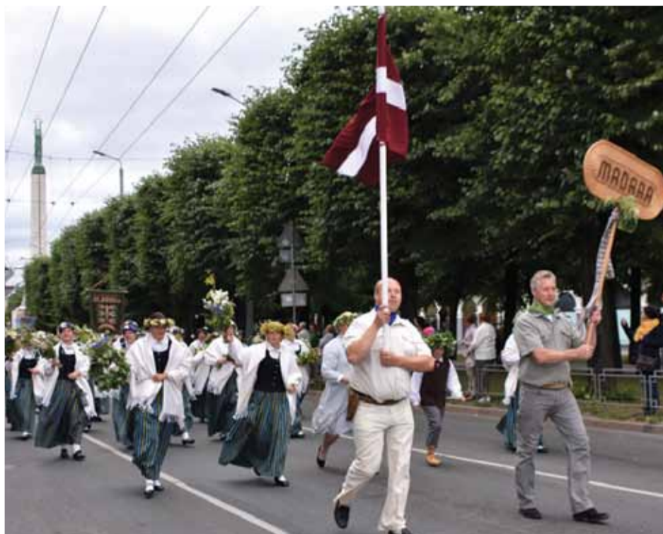
Sieviešu koris „Madara” svētku gājienā.