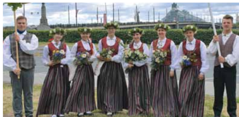
Koklētāju ansamblis „Tine”.