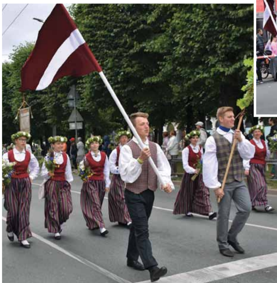
Koklētāju ansamblis „Tīne” svētku gājienā.