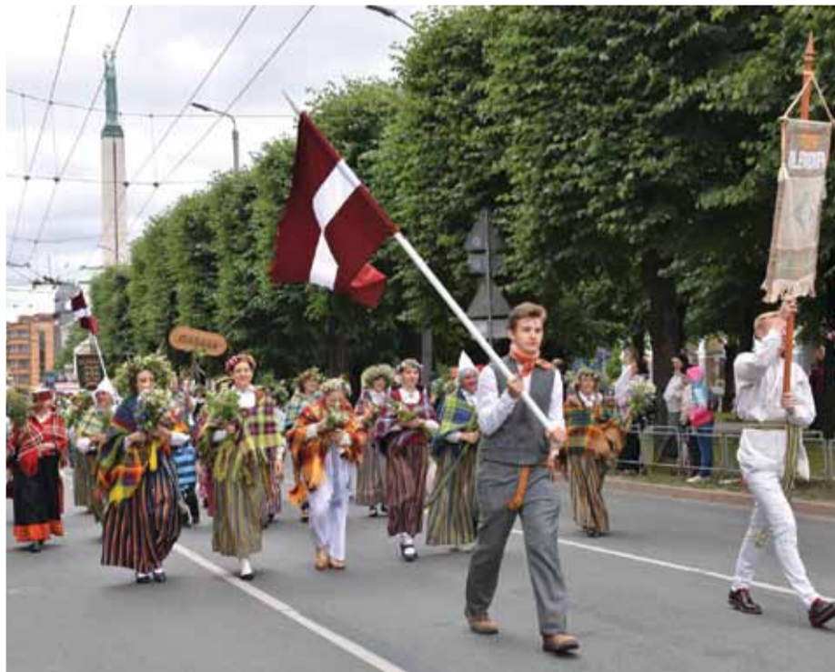
Tautas lietiskās mākslas studija „Ulbroka” svētku gājienā.