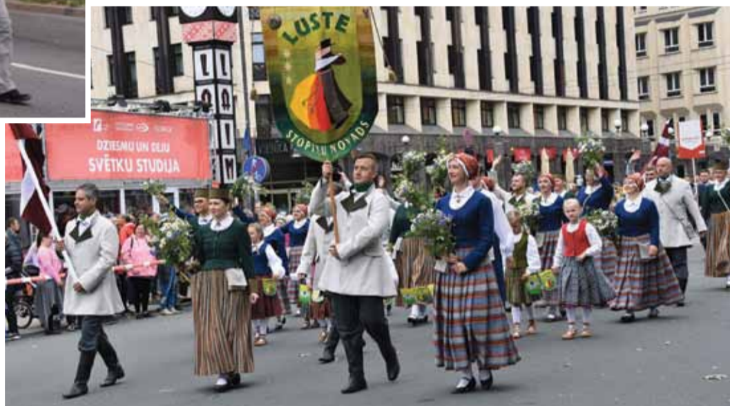
VPDK „Luste” svētku gājienā.