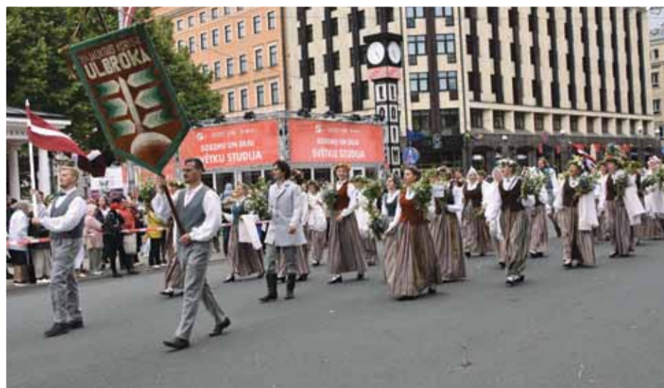
Jauktais koris „Ulbroka” svētku gājienā.