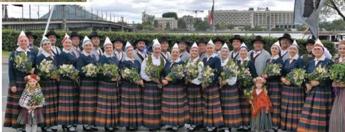
Senioru deju kolektīvs „Ulenbroks”.