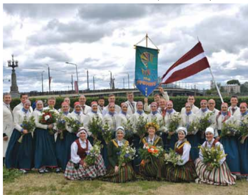
Vidējās paaudzes deju kolektīvs „Stopiņš”.