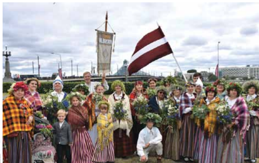
Tautas lietišķās mākslas studija „Ulbroka”.