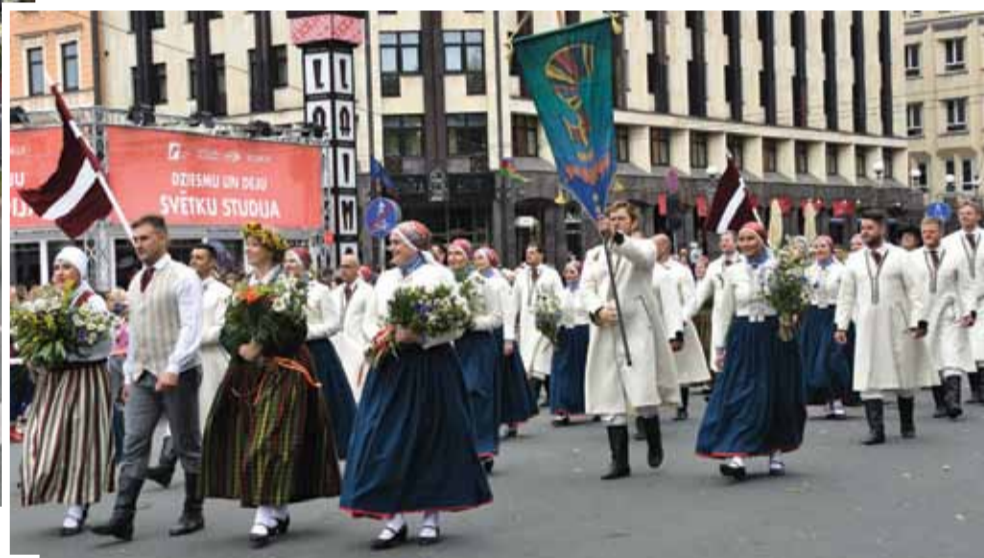
Vidējās paaudzes deju kolektīvs „Stopiņš” svētku gājienā.