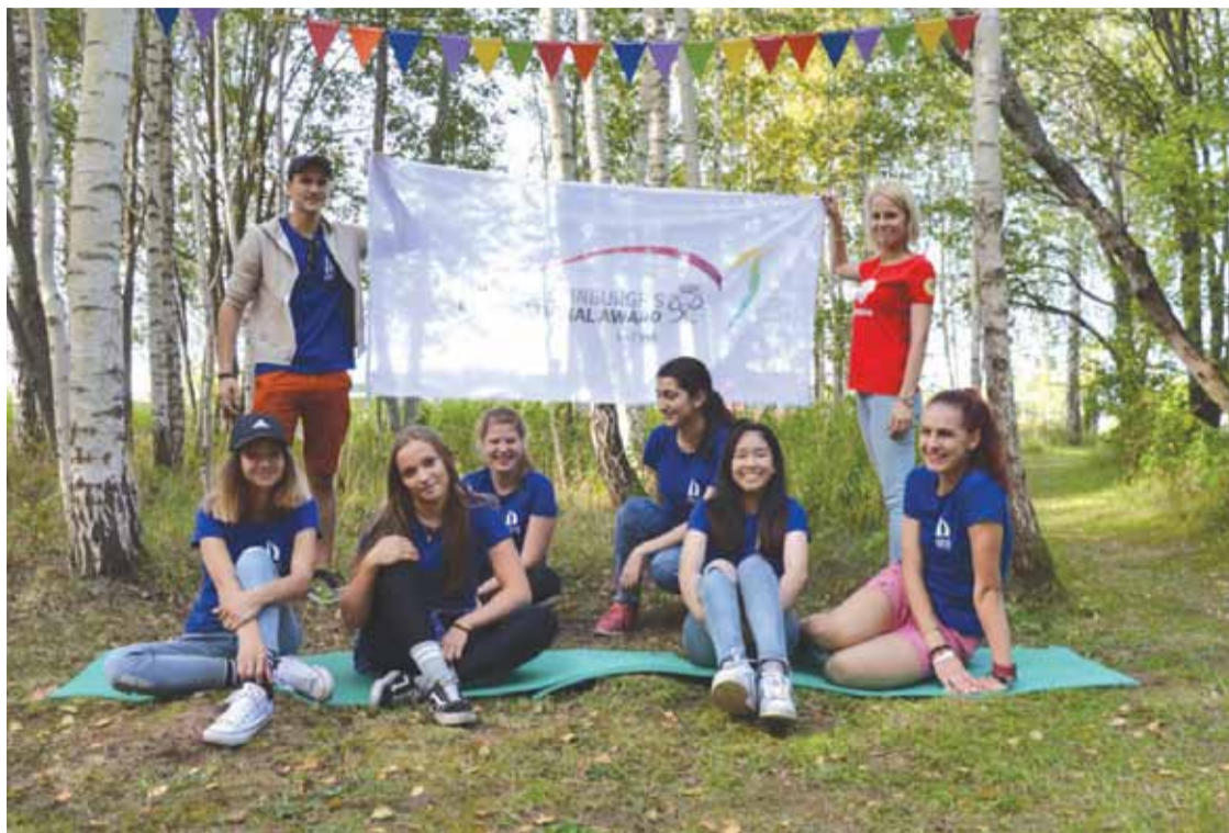
Ulbrokas vidusskolas Award vienības dalībnieku kopīgais foto desmitajā Award talkā Likteņdārzā

Pēc oficiālās Kokneses fonda organizētās Ābolu balles atklāšanas talkas dalībnieki devās veikt uzticētos darbus. Kamēr lielākā daļa talkas dalībnieku rūpējās par kociņu sagatavošanu rudens-