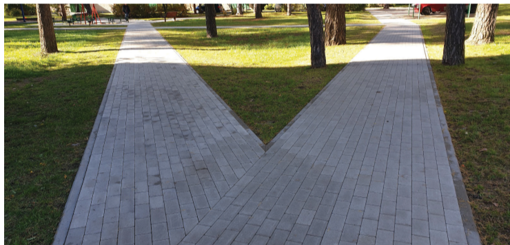
Upesleju ciema iekšpagalms.