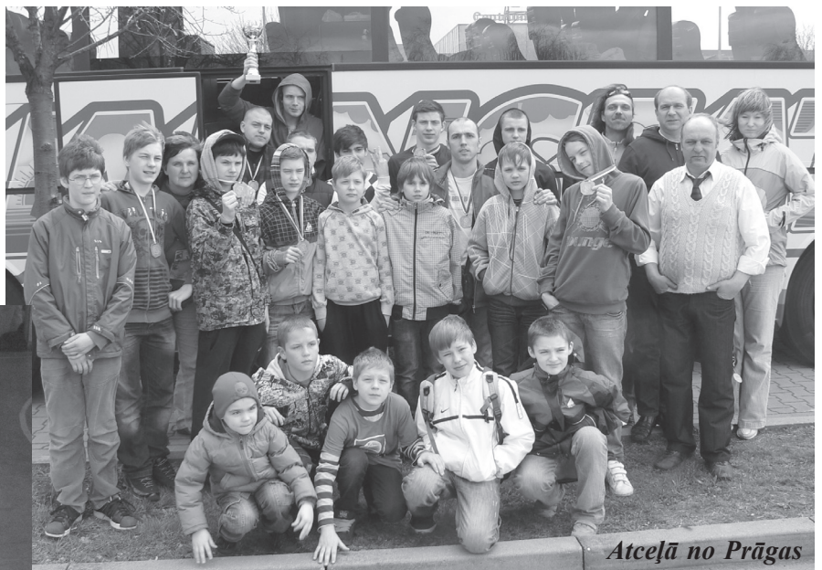
Atceļā no Prāgas