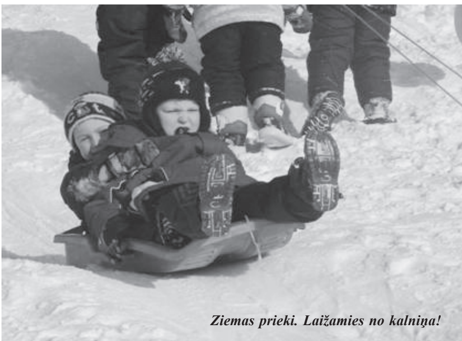
Ziemas prieki. Laižamies no kalniņa!

Vēlos pateikt lielu paldies vecākiem par atsaucību un atbalstu mūsu rīkotajos pasākumos. Paldies arī skolotājiem un skolotāju palīdzēm par izdomu, radošumu un atbalstu visos pasākumos!