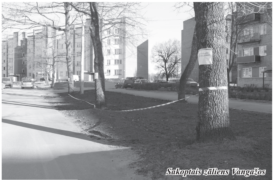
Sakoptais zāliens Vangažos

Pavasaram atnākot iezīmējās arī negatīvi fakti. „Liels lūgums automašīnu īpašnie-