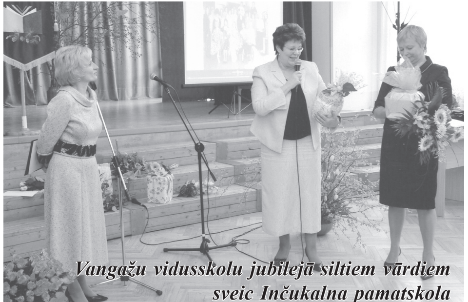
Vangažu vidusskolu jubilejā siltiem vārdiem sveic Inčukalna pamatskola

30.aprīlī Vangažu vidusskola svinēja 50 gadu jubileju. Svinīgā koncerta programma tika veidota apkopojot skolas vēsturi 5 desmitgadēs. Atmiņu krelles kopā savērt palīdzēja foto mirkļi un desmitgadei īpaši piemērotais muzikālais priekšnesums.