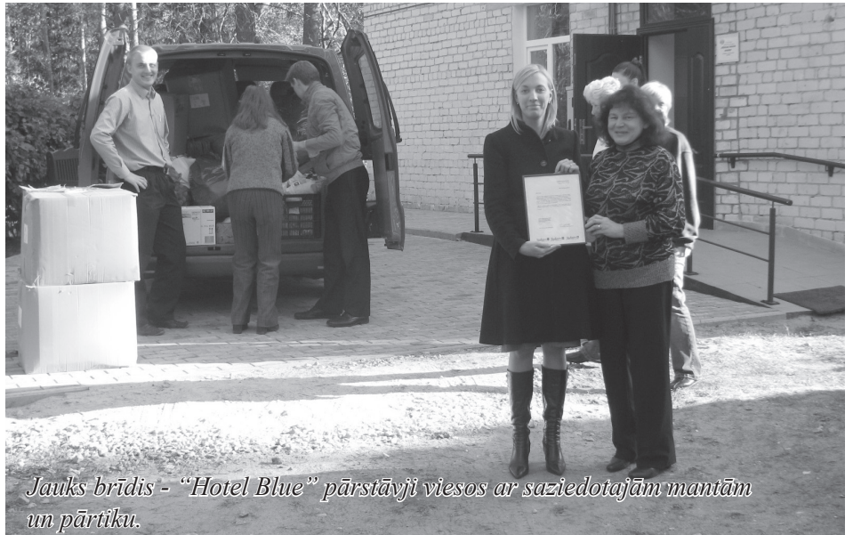
Jauks brīdis - "Hotel Blue" pārstāvji viesos ar saziņotajām mantām un pārtiku.

Katru mēnesi 30 - 40 ģimenes saņem pārtikas pakas. Paldies Jānim Pavlovičam, kurš nopirka divas tonnas kartupeļus un ziedoja pārtikas bankai – tos dalām ģime-