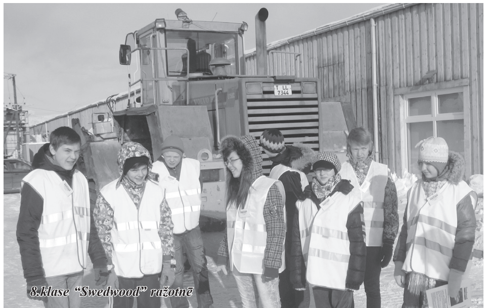
8.klase "Swedwood" ražotnē

zinātnēm. Lielākā daļa no mums nākotni cerēja saistīt ar mākslu.