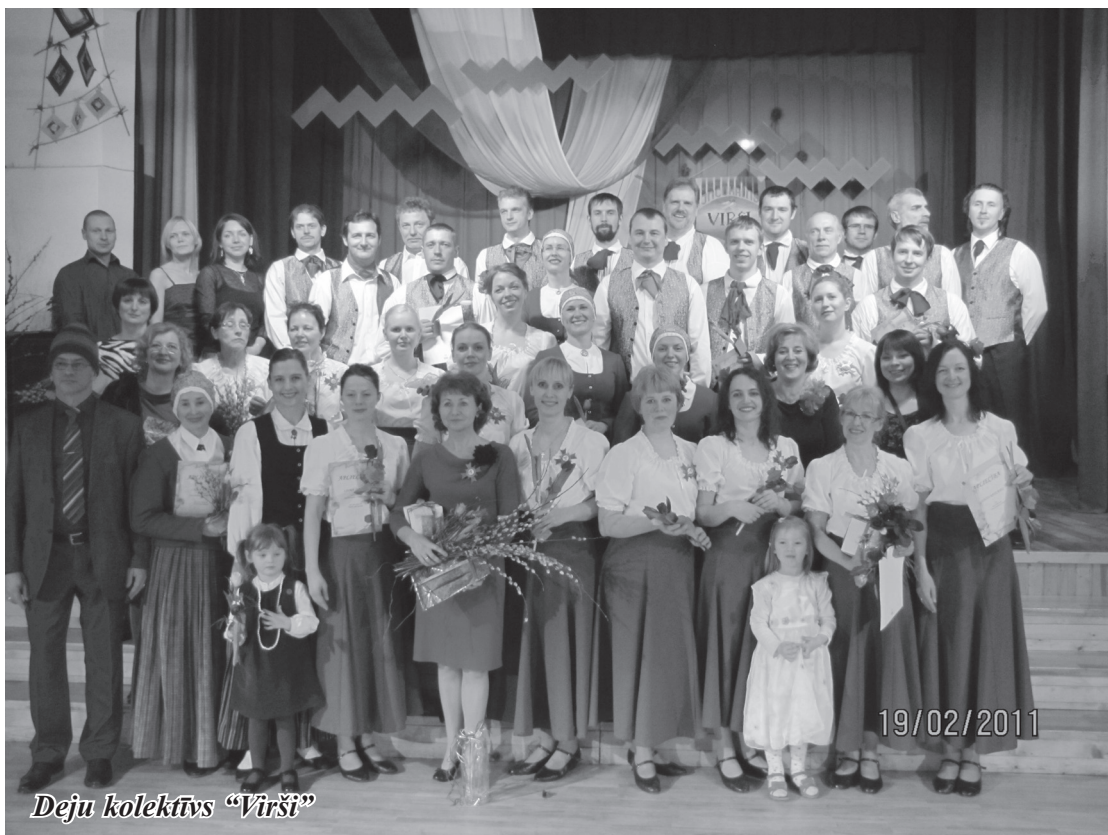
Deju kolektīvs „Virši”

Apsveicam mūziķus un viņu pedagogus! Paldies vecākiem par atbalstu!