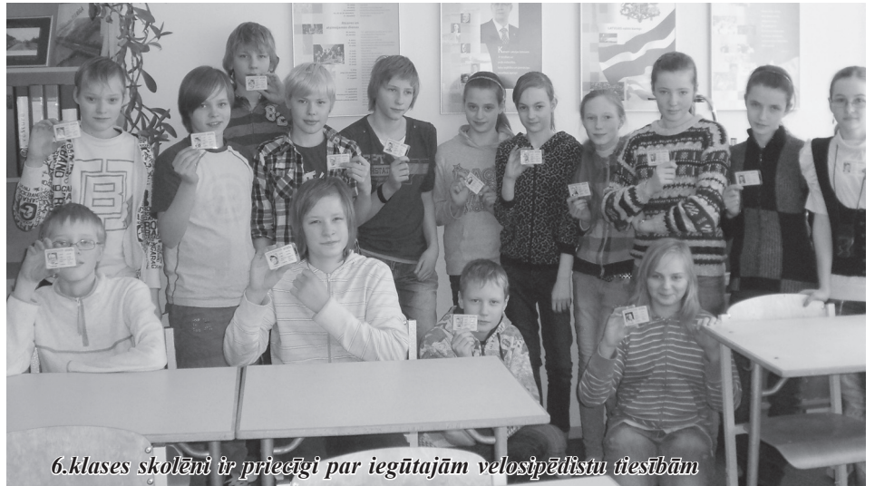
6.klases skolēni ir priecīgi par iegūtajām velosipēdistu tiesībām

Mūsu klase strādāja pie tēmas "Karjeras izvēle". Centāmies izzināt kādās profesijās nākotnē varētu strādāt. Mēs pildījām dažādus testus, lai mēģinātu saprast, kas mūs saista. Testos bija dažādi karjeras virzieni. Centāmies noskaidrot, vai mūsu darbs varētu saistīties ar tehniku, dabu, cilvēkiem, mākslu vai pacietību prasošām