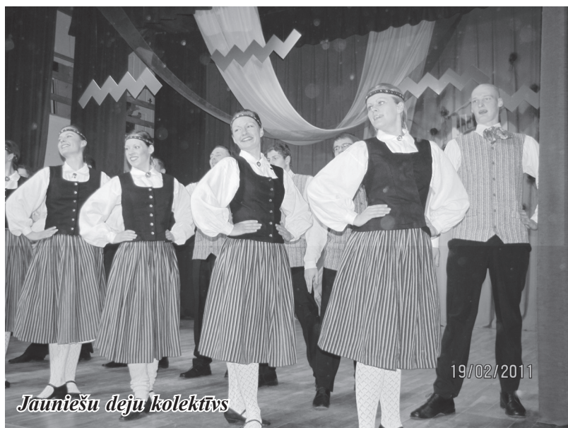
Jauniešu deju kolektīvs