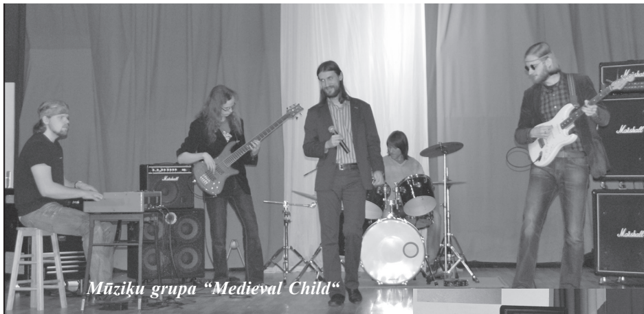
Mūziķu grupa „Medieval Child”