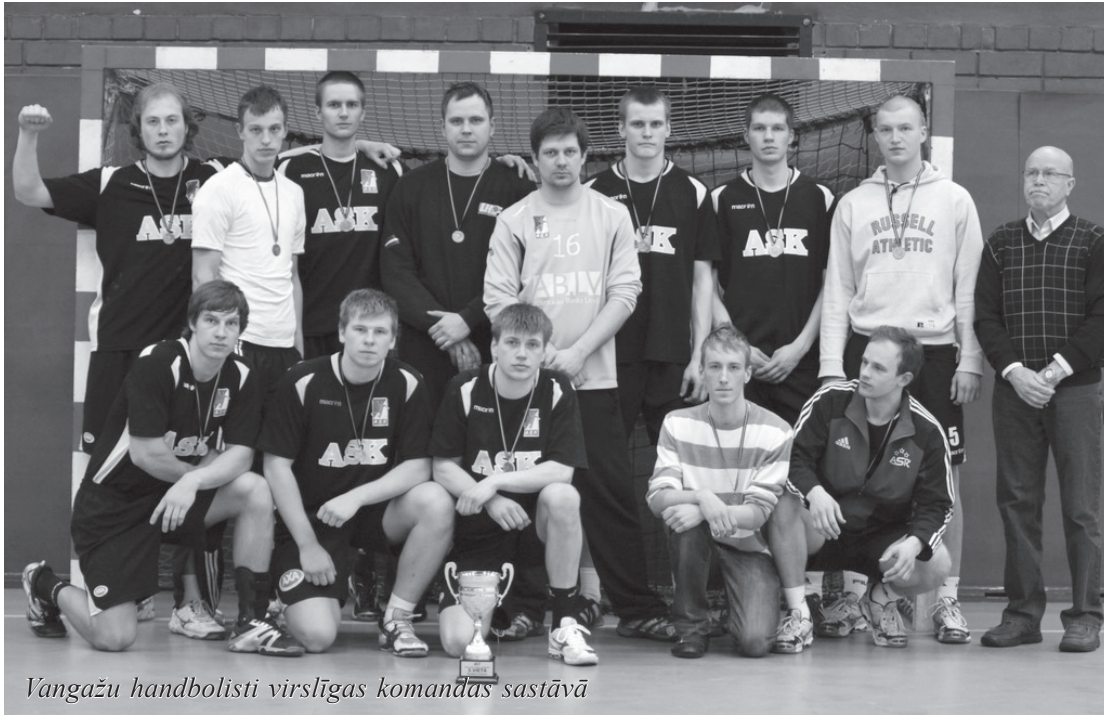
Vangažu handbolisti virslīgas komandās sastāvā

turnīrā Lībekā (Vācija), 50 komandu konkurencē iegūstot 5.vietu. 2010.gada rudenī Vangažu handbola komanda piedalījās pārbaudes turnīrā Igaunijā.