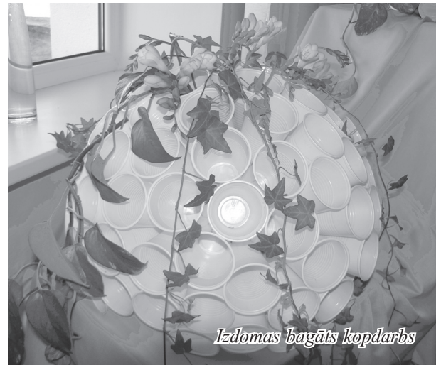
Izdomas bagāts kopdarbs

Kopējais izstādes apmeklētāju skaits tuvojās 300. Viesu grāmatā daudz atzinīgu un sirsniņu vārdu. Noslēgumā kultūras nama darbinieki bija sagatavojuši katrai dalībniecei diplomu un divas puķu sēklu paciņas. Arī nelielu kafijas galdu. Paldies