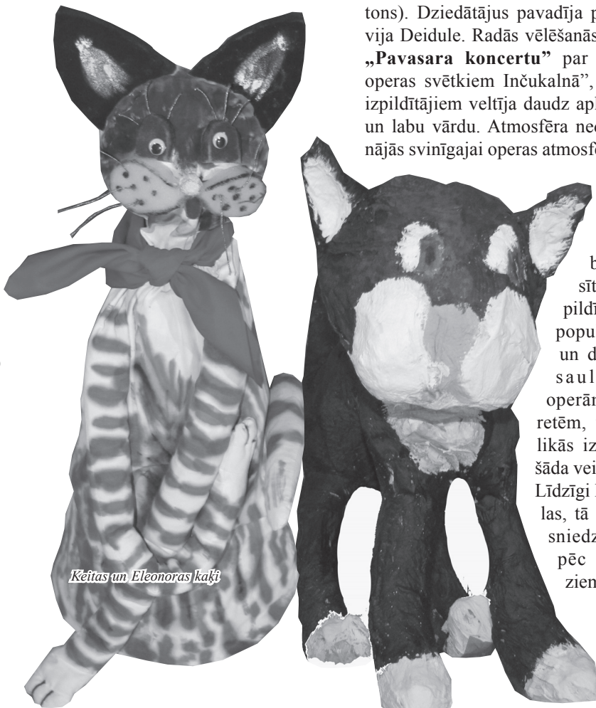
Keitas un Eleonoras kaķi