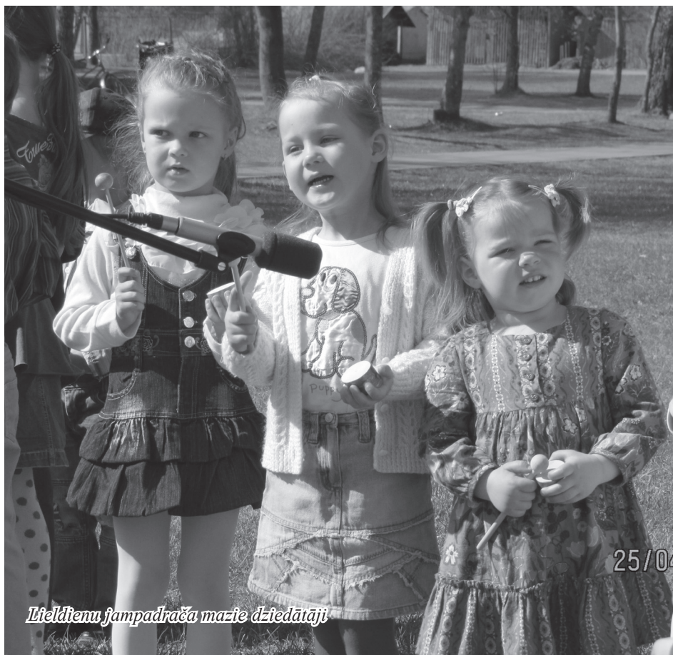
Liēdienu jampadrāča mazie dziedātāji

kaķa izveidošanā ir izmatotas daudzveidīgas tehnikas – šūšana, līmēšana, apgleznošana, veidošana u.c.