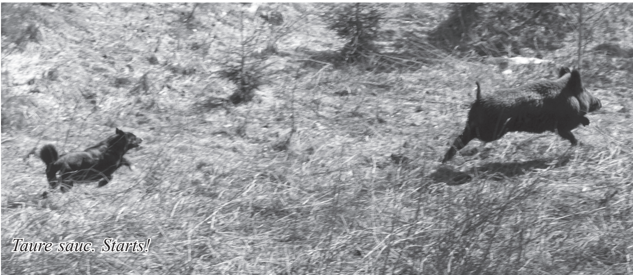
Taure sauc. Starts!

notiks 2012.gadā turpat, starptautiskajām prasībām atbilstošajā Inčukalna novada „Liepkalnu” aplokā.