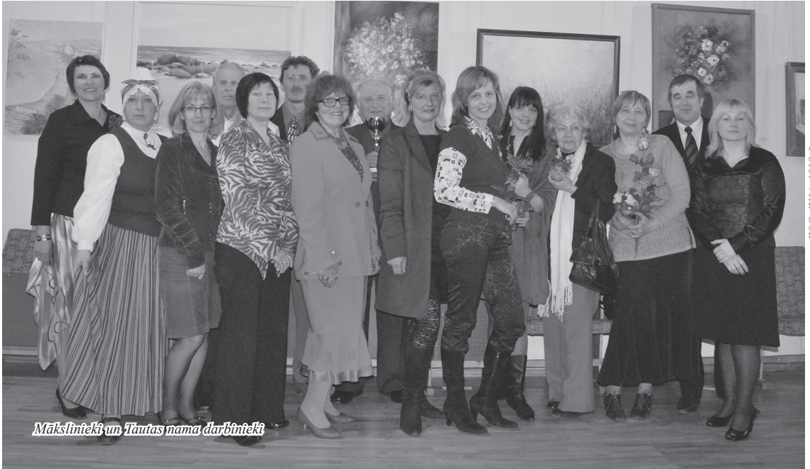
Mākslinieki un Tautas nama darbinieki

Kad mežs vēl joprojām bija neizbrienams, jo lāmu un dubļu vairāk nekā taciņu, kad gājputni vēl īsti nebija atraduši sev piezemēšanās vietu un kad vizbulītes nemaz vēl tik viegli atrast nevarēja, bērzu sula jau teceja traukos. Inčukalniešiem bērzu sulas degustācija no šampanieša glāzēm nāca komplektā ar uzmundrinoši pavasarīgas operu un operešu mūzikas baudīšanu, jo