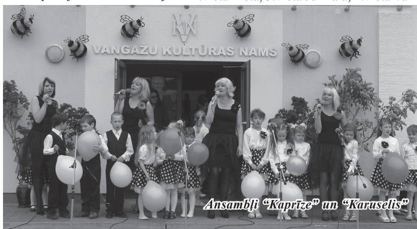
Ansamblis "Kapriže" un "Karuselis"

Futbolistu rezultāti: 1.vieta Supernova, 2.vieta Meta, 3.vieta Jūrmala, 4.vieta Van-