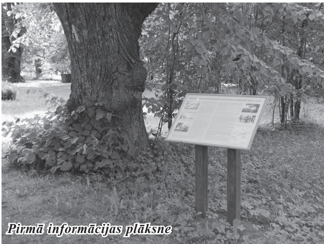
Pirmā informācijas plāksne