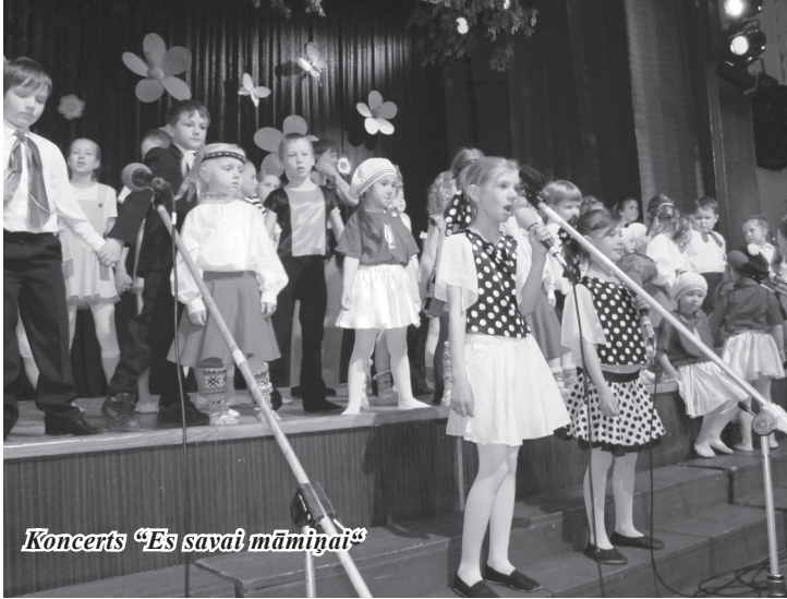
Koncerts „Es savai māmiņai”

cīt vienmēr, taču šī diena bija iespēja katram bērnam pateikties savai māmiņai par gādību un nesavtīgām rūpēm ar saviem priekšnesumiem.