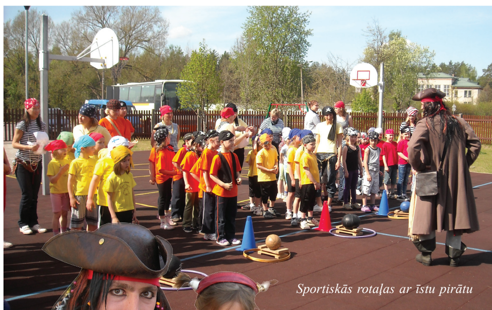
Sportiskās rotaļas ar īstu pirātu