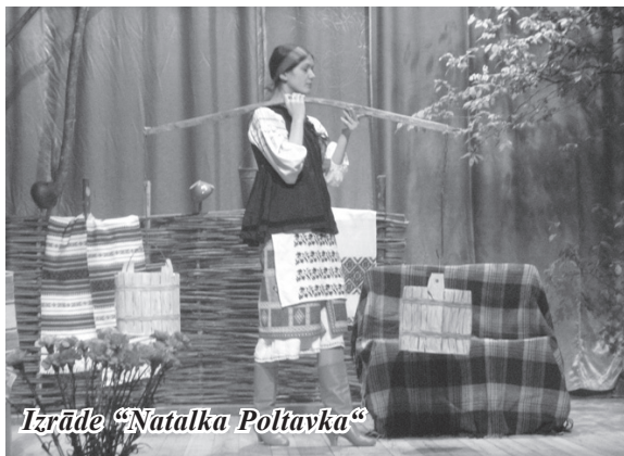
Izrāde "Natalka Poltavka"

braši soļoja aiz skanīgā Inčukalna pūtēju orķestra, gan koncertā! Paldies bērnu vecākiem par atbalstu!