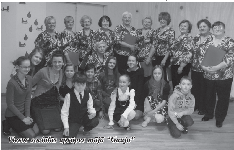
Viesos sociālās aprūpes mājā “Gauja”

Visu novembri un decembra pirmo pusī bērni cītīgi bija zīmējuši darbiņus