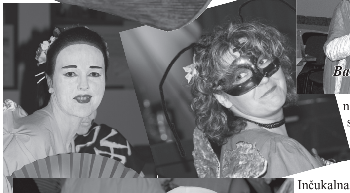
Bargi jautrā žūrīja