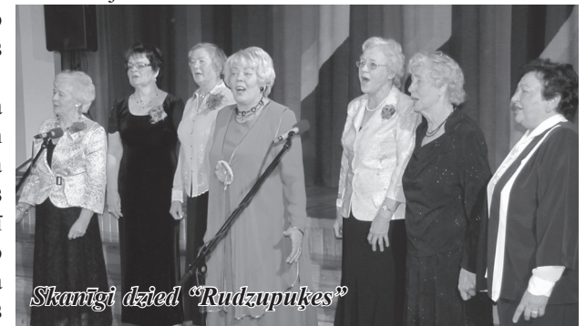
Skaņīgi dzied „Rudzupuķes”

kurās iemūžināts Inčukalns un inčukalnieši 575. jubilejas gadā. Liels paldies visiem