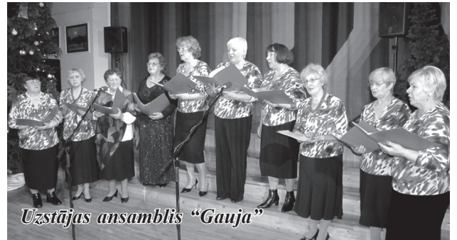
Uzstājas ansamblis „Gauja”

kaut kam nopietnam – fotokonkursam „Mans Inčukalns”. Gada laikā četrās konkursa kārtās piedalījās 21 autors, tika iesūtītas vairāk nekā 500 fotogrāfijas,