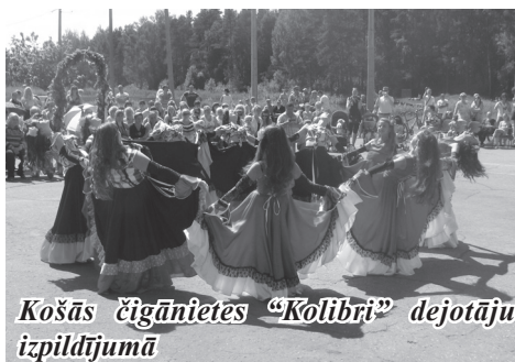
Košās čigānietes “Kolibri” dejotāju izpildījumā