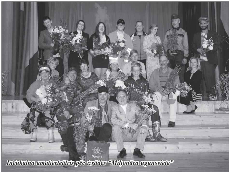
Inčukalna amaterteātris pēc izrādes "Miljonāra ugunsvieta"