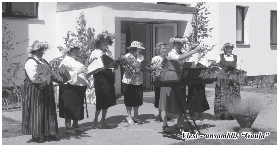
Viesi - ansamblis „Gauja”

citām piemērotām ziņgēm. Dziedāja gan jauktais ansamblis, gan vīru grupa, kur katrs bija solists. Paldies viņiem!