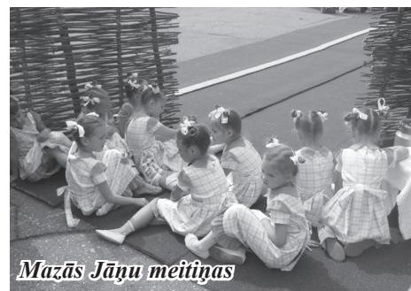
Mazās Jāņu meitiņas