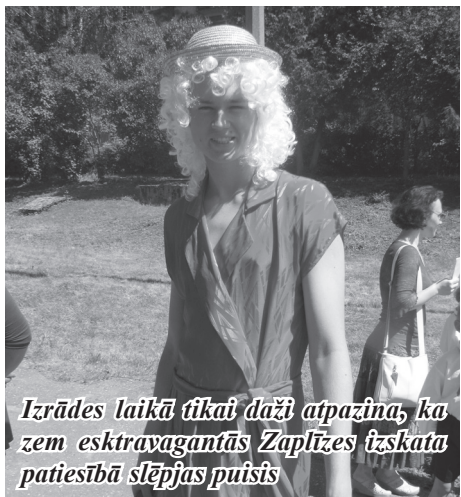
Izrādes laikā tikai daži atpazīna, ka zem ekstravagantās Zaplīzes izskata patiesībā slēpjas puisis

pieaugušie. Jau sen zināms, ka Vangažu pašdarbības kolektīvi ir spējīgi uz lielām lietām. Šis pasākums bija vēl viens apliecinājums tam. Gaidījām uzvedumu nevis kā pienākumu, bet kā iespēju, vienojoties darbā, lieliski atpūsties. Prieks, ka bija tik daudz skatītāju, tas deva vēl lielāku iedvesmu.”