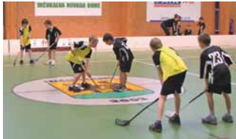
Jaunākie Inčukalna florbolisti mājās spēlēs pret Liepājas komandu.