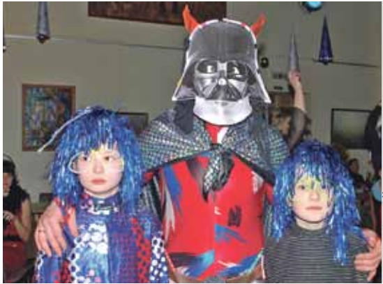
Karnevāls pulcēja dažādus tēlus – pat atbraucējus no citām planētām.

Kur izklaides, tur arī pats nelabais ar radziņiem klāt. Šis gan bija ļoti simpātisks, smaidīgs, laimīgs un uz lustēšanas kārs.