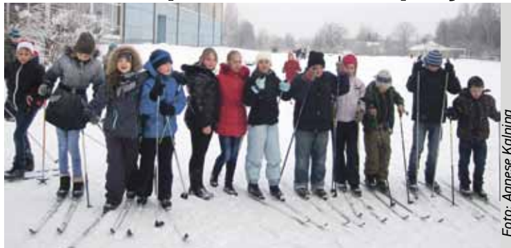
Lai gan slēpošana nav viegls sporta veids, tas bērnos rada prieku un uzlabo veselību.

Ir aizvadīts pirmais mācību pusgads, nosvinēts Jaunais gads, skolēni kārtīgi brīvdienās atpūtušies. Lai apstākļi ir atbilstoši gadalaikam, un mūs lutina īsta Latvijas ziema ar skaistu, baltu sniedzīgu. Tāpēc sporta stundās ir iespēja slēpot.