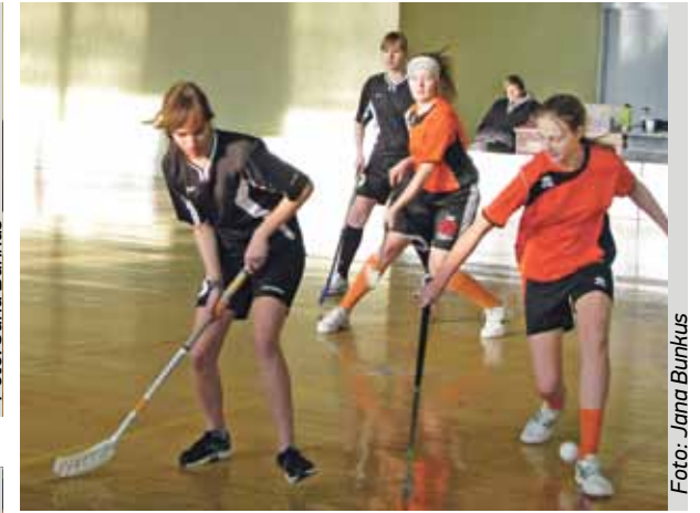
Meitenes bija iemesls uzslavēt – visa spēle nospēlēta bez maiņām.

Kā iepriekšējā numurā minēju, esmu priecīgs strādāt ar lielo zēnu komandu, kura ir „ieskrējusies”, un, savaldot savas emocijas un pārdzīvojumus, esam uzvarējuši pēdējās divās čempionāta izbraukuma spēlēs. Mēs turpinām iesāktu ceļu uz izslēgšanas spēlēm, un gribētos šogad pacīnīties arī par godalgotām vietām. Tā turpināt, un uzvarētāji un ieguvēji būs mēs visi! Aiziet!