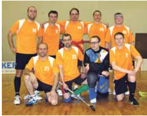
Veterāni – lepi par divām uzvarām pēdējo spēļu metienos.

Izturību vecākiem, kuriem jāatceras, ka par zinātniekiem un sportistiem nepiedzimst – ir jānācās un jātrenējas, lai sasniegtu savus mērķus.