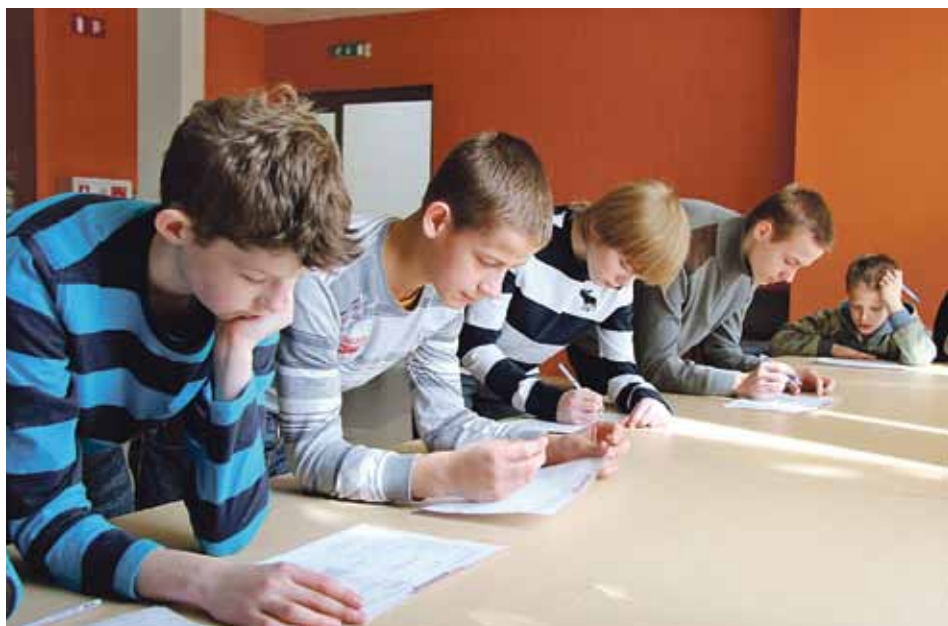
Atvērto durvju diena Olimpiskajā sporta centrā