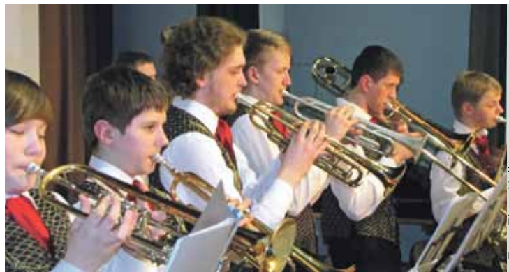
Pūtēju orķestru priekšnesumi allaž ines īpaši svinīgu noskaņu.

„Miljonāra ugunsvieta” un „Kvēli Ilgotā”), kā arī ieskatīties nākotnes izrādē – N.Gogoļa „Precības”. Tā kā