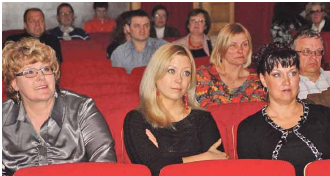
Žūrija un skatītāji