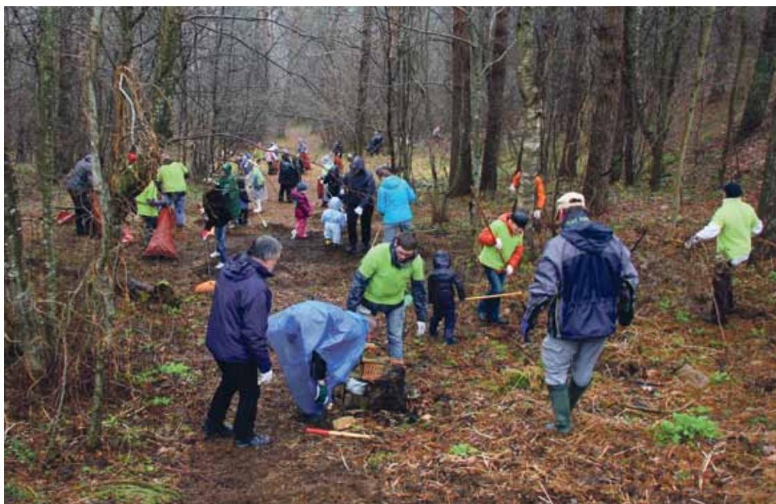
△ Lielākā talcnieku kompānija, kas Gaujas ciemā tīrīja gravu, izvietoja tur soliņus un uzstādīja putnu būrišus.

Paldies visiem, kas, neskatoties uz nepatīkamajiem laika apstākļiem, devās laukā no mājām, lai sakoptu mūsu novadu!