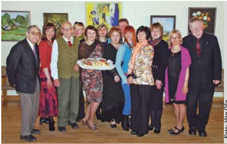
Inčukalna mākslinieku kopas dalībnieki