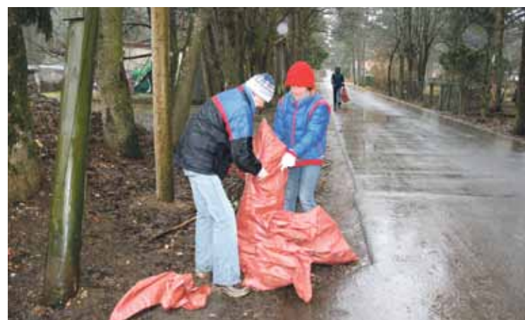
Visi talcnieki bija smaidīgi un apņēmības pilni paveikt ieplānotos darbus, neskatoties uz aukstumu un lietu.