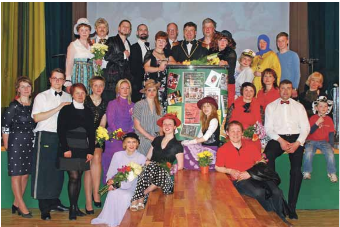
Inčukalna amatierteātrim 10.sezona. Sumināti!

Atgādinājums – nepilngadīgās personas pēc plkst.22.00 sabiedriskos pasākumos drīkst atrasties tikai kopā ar vecākiem!