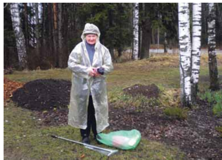
△ Lietus nav patīkams, bet tas nav šķērslis labiem darbiem.