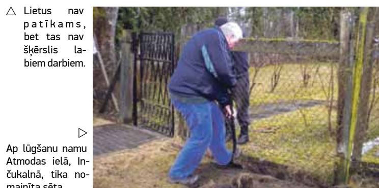
▷ Ap lūgšanu namu Atmosdas ielā, Inčukalnā, tika no-mainīta sēta.