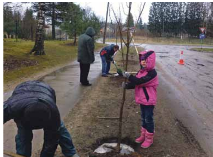
Kociņu stādīšana Vangažos deva īpašu gandarījumu, zinot, ka tie kuplos un zels vēl ilgu laiku.

Visas fotogrāfijas no talkas apskatāmas mājas lapā www.incukalns.lv .