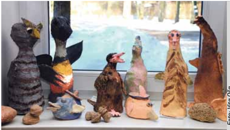
Bērnu darbi izstādē „Putni”