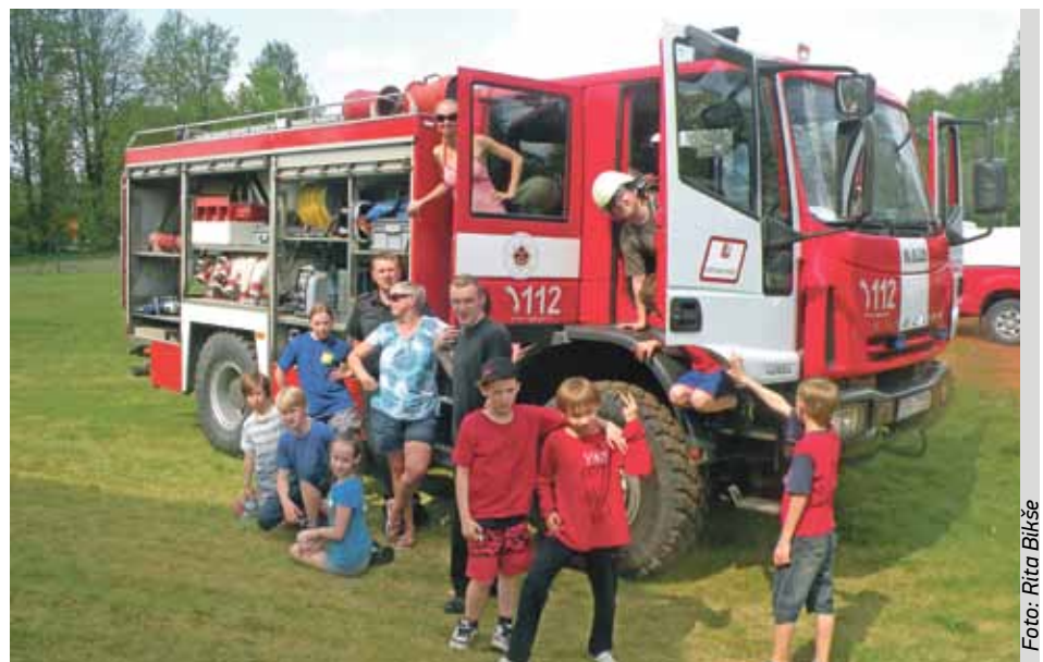
Aktīvākie dalībnieki pēta ugunsdzēsības tehniku un aprīkojumu.

Inčukalna brīvprātīgo ugunsdzēsēju biedrība (www.incukalnabub.lv) ■