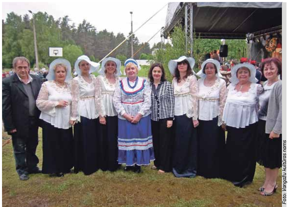
Kopā ar lirisko dziesmu ansambli „Lubava” no Liepājas

Tagad kolektīvi ar savu sniegumu priecē ne tikai mūsu pilsētas iedzīvotājus, bet arī daudzu citu Latvijas, Lietuvas, Ukrainas, Baltkrievijas pilsētu iedzīvotājus – tie >