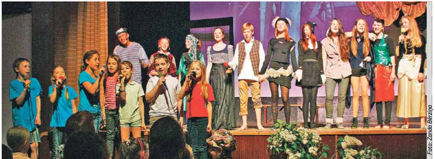
Bērnu vokālais ansamblis „Karuselis” (priekšplānā) un teātra studijas „Pigorīņi” dalībnieki muzikālās izrādes „Brēmenes muzikanti” laikā

Ir sācies košākais un saulainākais gadalaiks – vasara. Paralēli ilgi gaidītajai atpūtai brīvā dabā ir iespēja baudīt arī krāšņus pasākumus. Prieks, ka vasara ieskandināta ar krāšņām dziesmām, dejām, uzvedumiem, sportošanu un citām jaukām aktivitātēm.