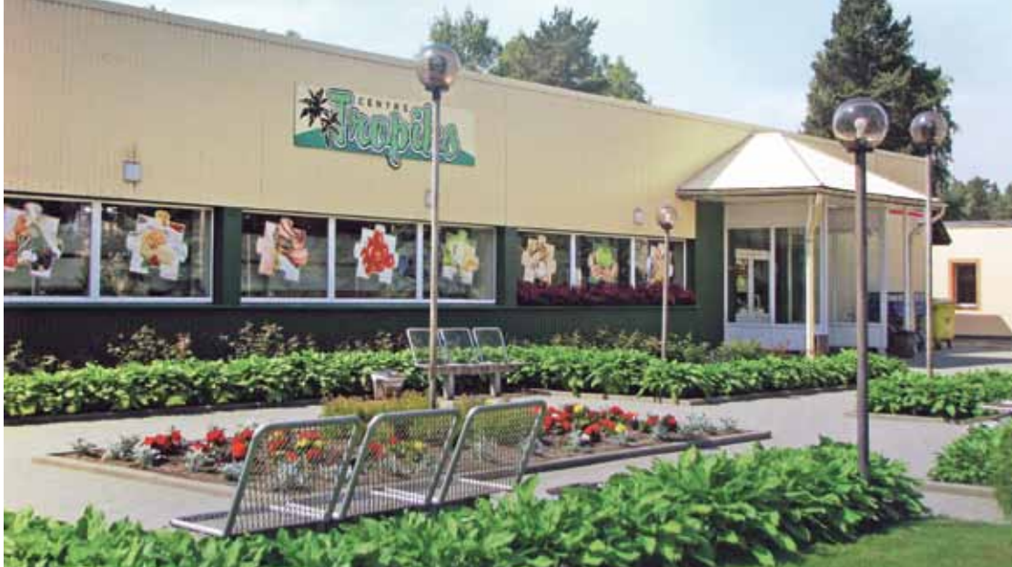
Veikals „Tropiks-Ali” Vangažos