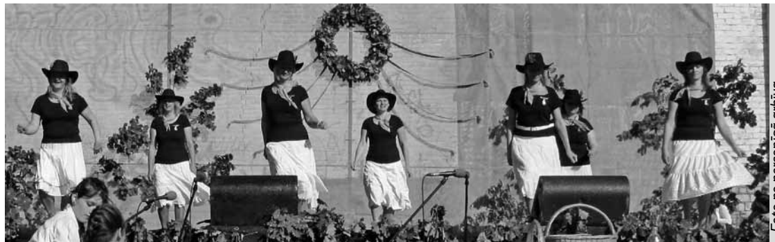
Līnijdeju grupas „Drime dance” lustīgā līgo deja.