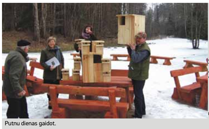
Putnu dienas gaidot.

kailcirtē. Šobrīd strauji mainās arī visas informācijas tehnoloģijas – meža datu apstrāde un kartogrāfija, bet visa mežu apsaimniekošana tomēr balstās uz klasiku – meža augšanas laikā, sākot no sēklas līdz iegūtai komerciālai koksnēi, tie principi ir klasiskie. Meža dienestā, un es domāju, ka arī citur, meža nozarē strādā jau pilnīgi cita līmeņa ieiešana mežā, ja tā var teikt. Speciālists uz mežu dodas ar GPS ierīcēm, kurās ir atspoguļota visa kartogrāfija. Cilvēks ar šo ierīču palīdzību mežā var izdarīt atzīmes par to, ko viņš redz, pēc tam tās saglabāt datubāzē, kur var veikt izmaiņas. Protams, tur ir vajadzīgas zināšanas pietiekamā līmenī, bet tas ļauj vienam speciālistam apsaimniekot daudz lielākas mežu