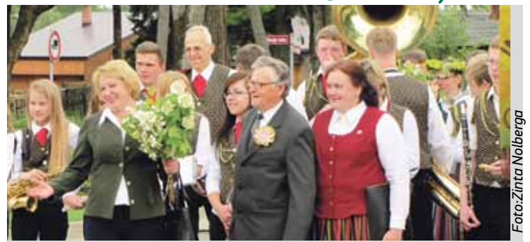
Pirms gājiena notiek priecīgas satikšanās, jaunas iepazīšanās, un svētki var sākties.