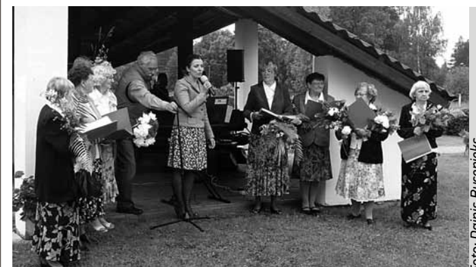
Ansambļa „Gauja” līgodziesmas skanēja lustīgi un pieskandināja visu tuvāko apkārtni.