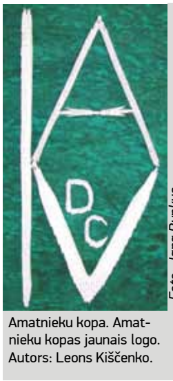
Amatnieku kopa. Amatnieku kopas jaunais logo. Autors: Leons Kīščenko.

DC „Vangaži” Amatnieku kopas dalībnieki ■