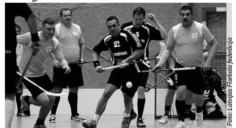
Vīru komanda „Coyote Inčukalns” (gaišajās formās) turpmāk sauksies „Inčukalns/Graanul Pellets”.