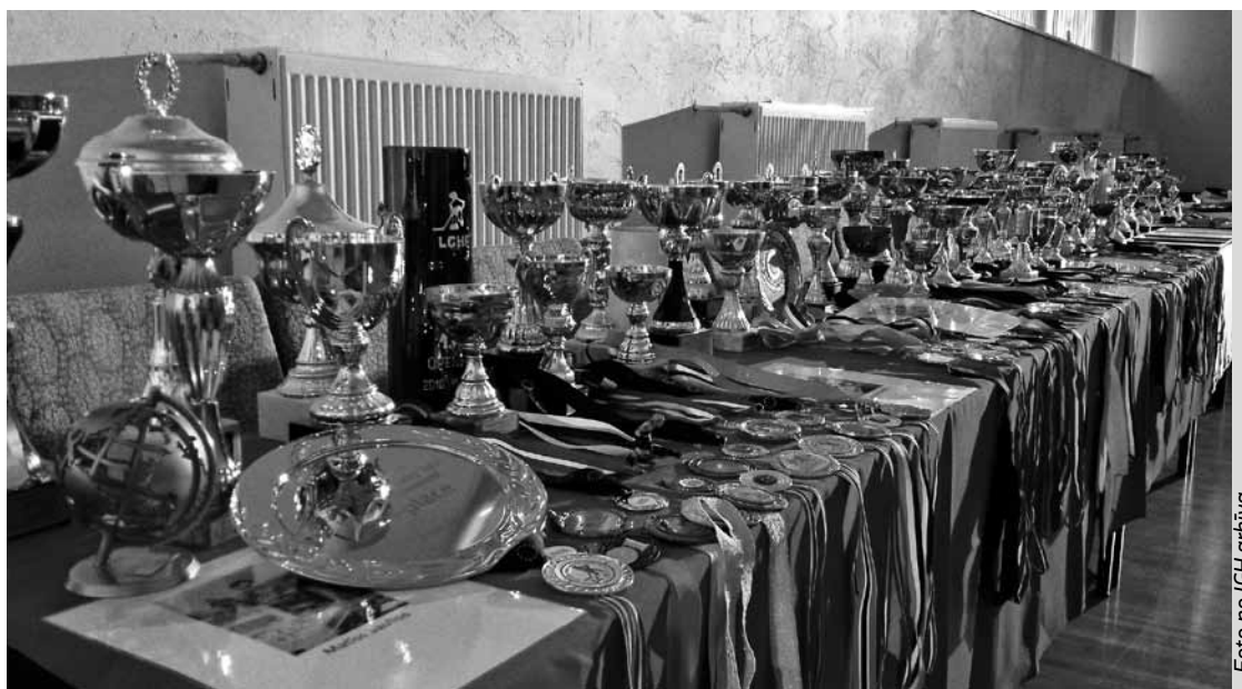
Inčukalna Galda hokeja klubs var lepoties ar gadu gaitā iegūtajiem daudzajiem kausiem un medaļām