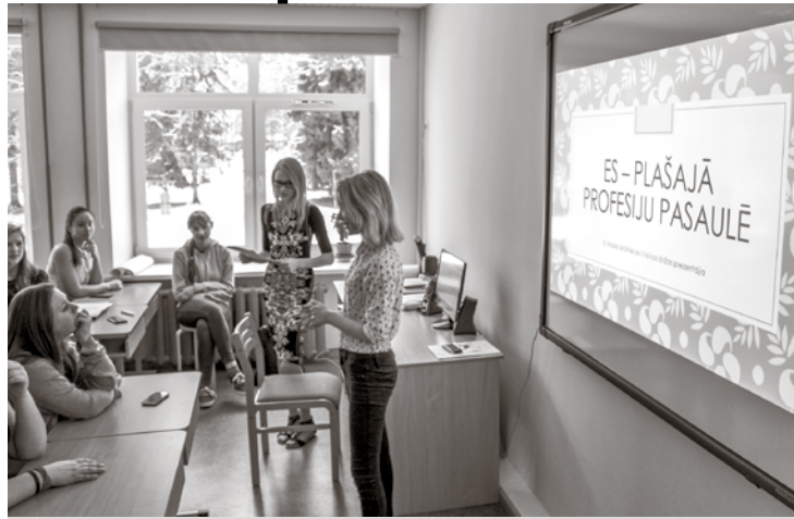
8. klase projektu nedēļā

8. klases Projektu nedēļas tēma bija „Es – plašajā profesiju pasaulē”. Skolēniem bija jāizzina sava personība, jāapzinās intereses un jāspēj orientēties Latvijas izglītības struktūrā. „Ko es gribu?”, „Ko es varu?”, „Kas man vislabāk padodas?” – jautājumi, kas gaisā virvoja visu nedēļu. Skolēni paši atzina, ka pats grūtākais ir izzināt pašam sevi un spēt prezentēt savu personību