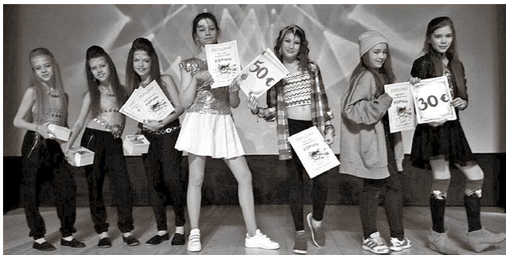
1.–3. vietu ieguvēji