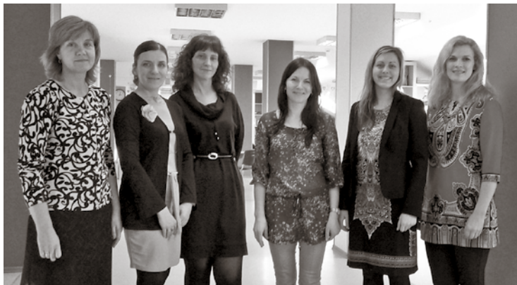
Inčukalna novada dienas centru vadītājas ar Baldones dienas centra „Baltais ērglis” kolēģēm

Tālāk devāmies uz dienas centru „Gaismas iela”, kurš gan vairāk darbojas kā dienas aprūpes centrs, jo šī