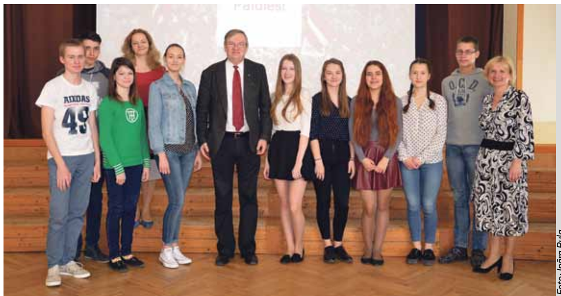
4.maijā tikšanās ar 12.Saeimas deputātu Romualdu Ražuku