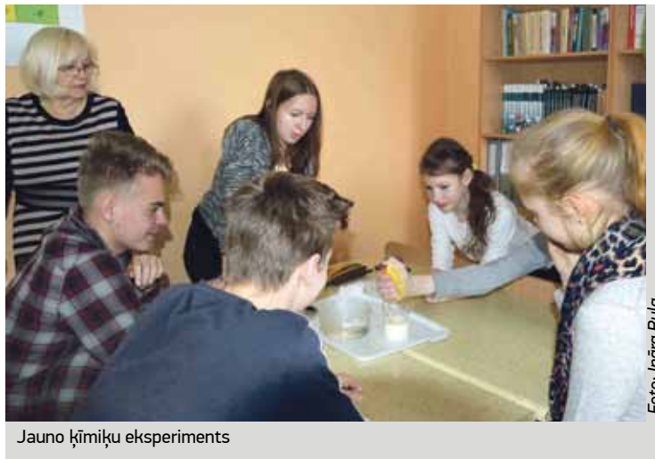
Jauno ķīmiķu eksperiments