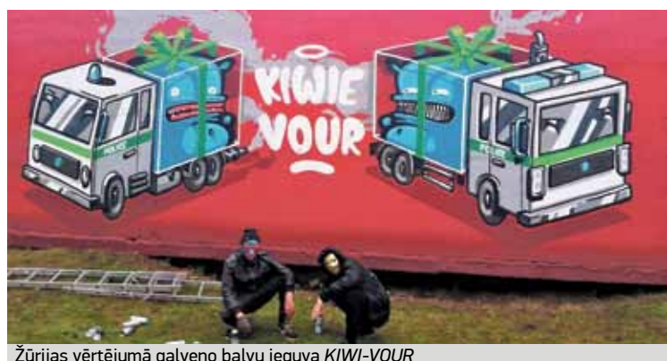
Žūrijas vērtējumā galveno balvu ieguva KIWI-VOUR

3. septembrī ar Inčukalna novada domes atbalstu Vangažos notika Vangažu 25. gadadienai veltīts Grafiti festivāls. Konkursa 1. kārtā darbu skices tika iesūtī-