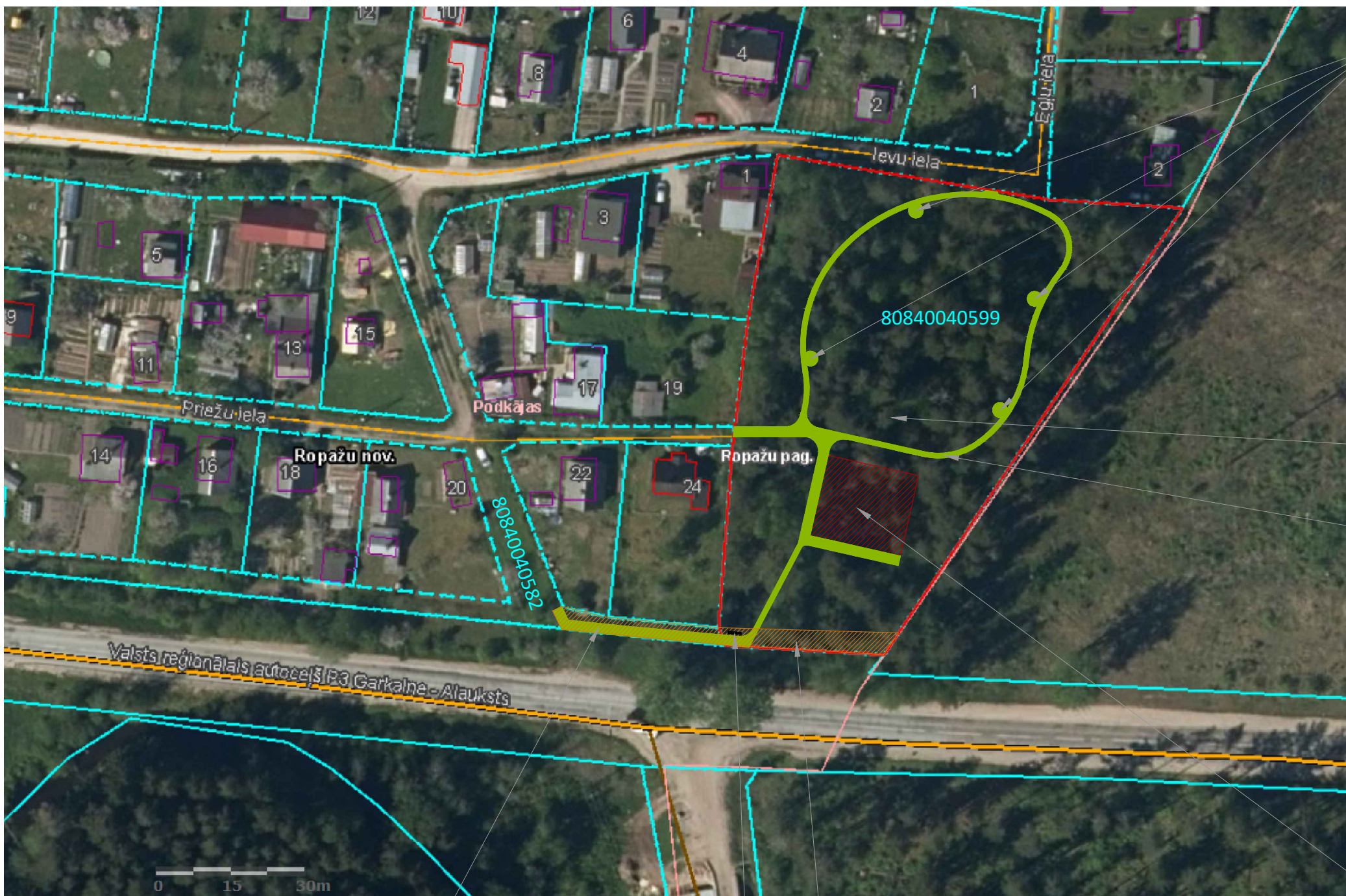
Gājēju ceļš ar grants segumu gar valsts reģionālo autoceļu, 85m 2